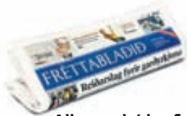
Allt sem þú þarft...