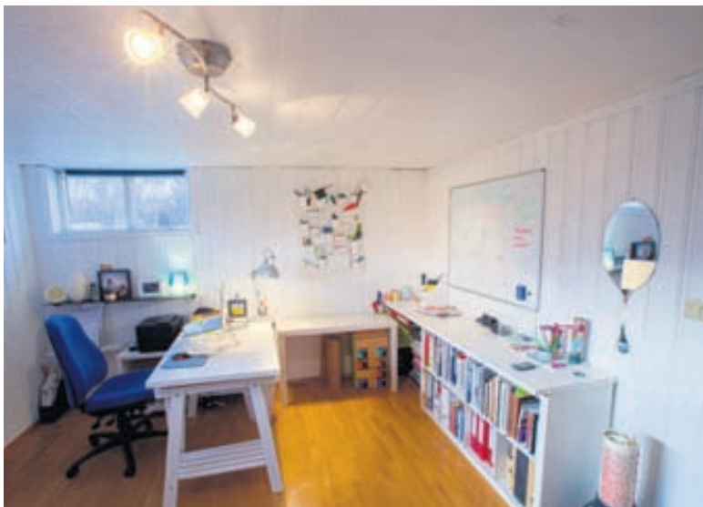
Takið eftir hversu vel vinnurýmið er skipulagt.