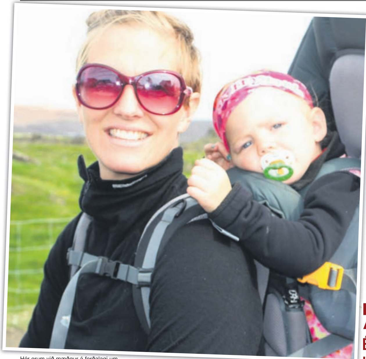
Hér erum við mæðgur á ferðalagi um Ísland.