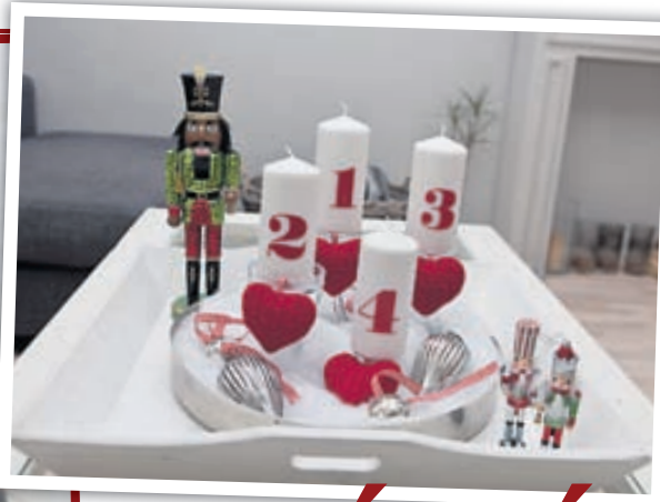
Þessi skemmtilegu kerti sem eru merkt adventu-vikunum eru úr Ikea.