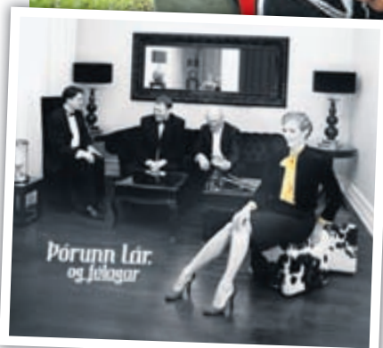
Útgáfutónleikarnir eru á miðvikudaginn 21. nóvember á Borginni klukkan 20.30.

í leikhúsinu og þegar hún var að æfa fyrir hin ýmsu hlutverk kynntist maður annars konar tónlist. Þau hjónin voru ekki mikið fyrir rokkið og okkur systrunum þótti alltaf ömurlagt að það voru bara til klassískar plötur á heimilinu, en við kynntumst rokkinu bara á annan hátt eins og allir vinir okkar! Maður sér það núna að það voru forréttindi að fá að kynnast klassískri tónlist svona vel!