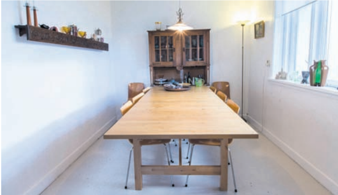
Hugmyndahönnuðurinn festi efri hluta skápsins við borð- stofuborðið til að nýta rýmið betur.