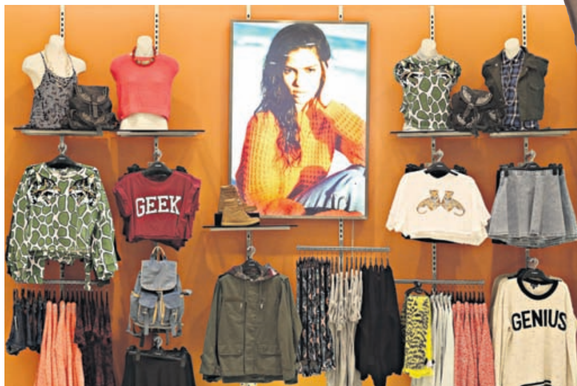
Magabolir, neonlitir, dýraprent og bakpokar verða áberandi á næstunni.