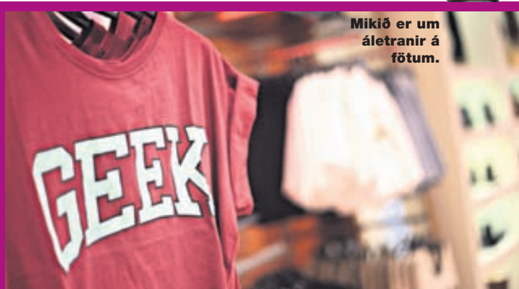
Mikið er um áletranir á fötum.