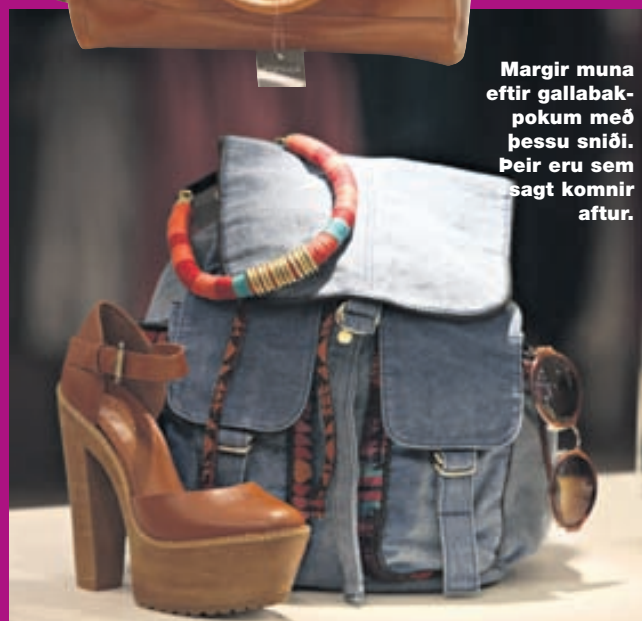
Margir muna eftir gallabakpokum með þessu sniði. Þeir eru sem sagt komnir aftur.