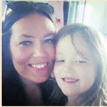
Mæðgurnar á góðri stundu.