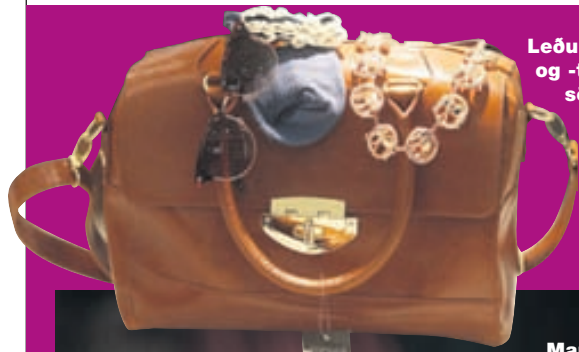
Leðurbakpokar og -töskur eru sömuleiðis áberandi.