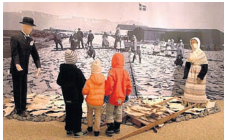
Áhugasöm börn í Þjóðminjasafninu.