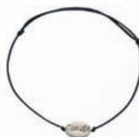
Seva armband VERÐ 3.900,-