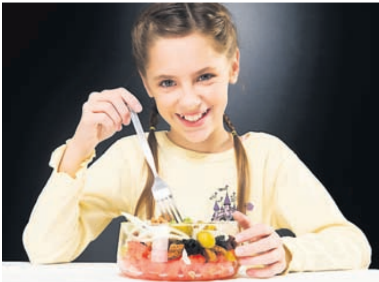
Skrautlegir ávextir skornir í bita geta komið í staðinn fyrir sælgæti um helgar.

Þú ráðleggur fólk líka um mataræði, ekki satt? „Ég er ekki