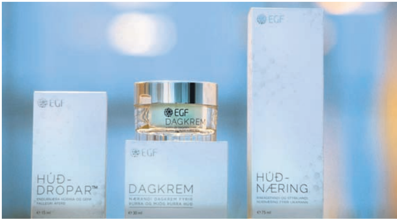
EGF Húðvörurnar frá Sif Cosmetics eru vinsælar innan lands sem utan.