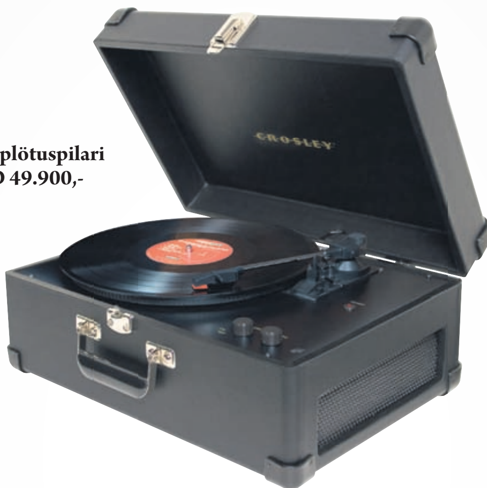
Crosely plötuspilari VERÐ 49.900,-