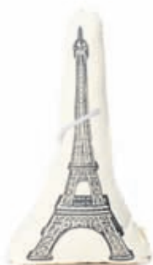
Eiffeltorn púði VERÐ 7.800,-