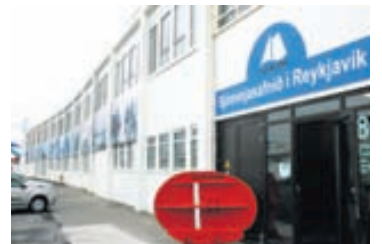
Sjóminjasafnið í Reykjavík, Grandagarður 8.

Þjóðminjasafn Íslands er fræðandi og skemmtilegt safn fyrir börn. Fjölskyldan getur skoðað muni frá hinum ýmsu tímum og einnig er hægt að taka þátt í safnleikjum, svo sem ratleik og fræðsluleik, sem gerir heim-