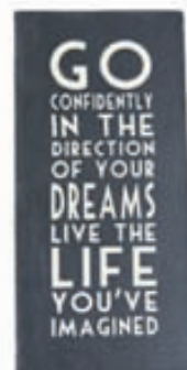
Skilti VERÐ 2.900,-