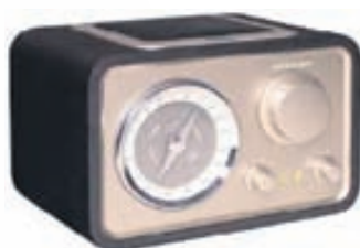
Crosely útvarp VERÐ 33.500,-