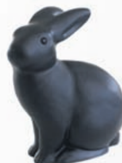
Dýraljós VERÐ 7.800,-