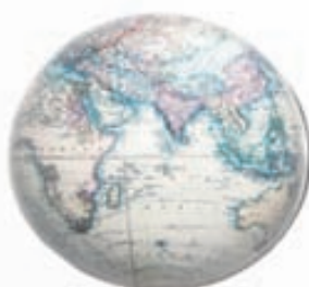
Heimurinn glerkúla VERÐ 5.900,-