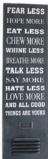
Skilti VERÐ 6.900,-