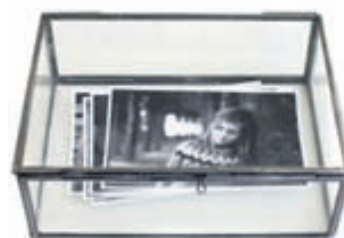
Glerbox VERÐ 4.900,-