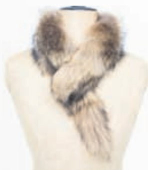
Þvottabjörn kragi lítill VERÐ 9.900,-