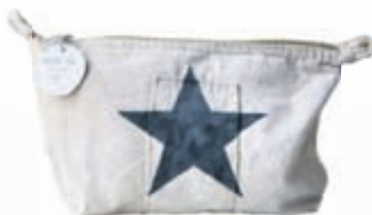
Stjörnutaska VERÐ 14.900,-