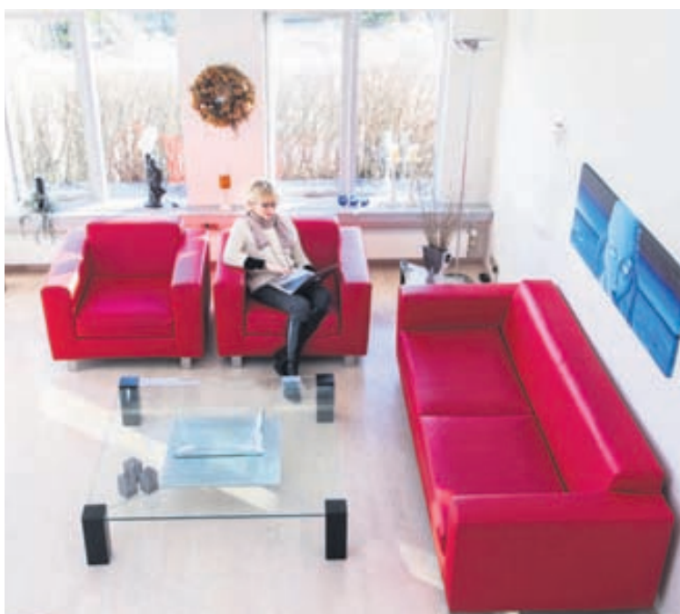
Rauða sófasettið setur sterkan svip á heildarmynd heimilisins.