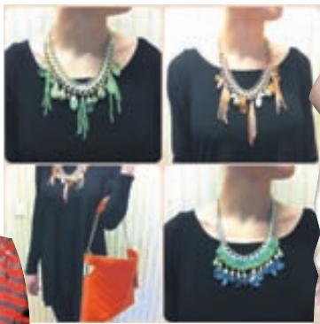
Litríkir aukahlutir eru áberandi.

A girl should be two things: classy and fabulous. Coco Chanel