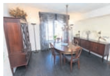
Klassískir munir skreyta heimilið.