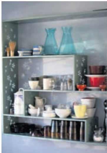
Skemmtilegar opnar hillur í eldhúsinu.