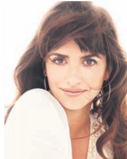
Penélope Cruz tekur sig vel út fyrir Lindex.