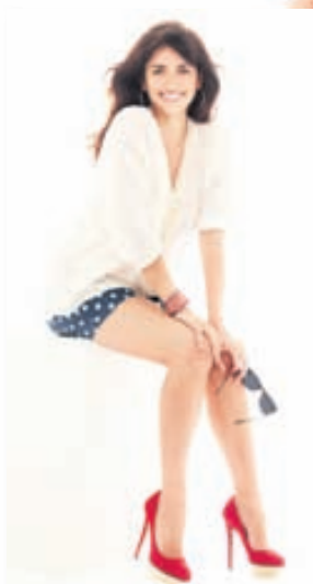
Sumarlínan er lifleg en klassísk.