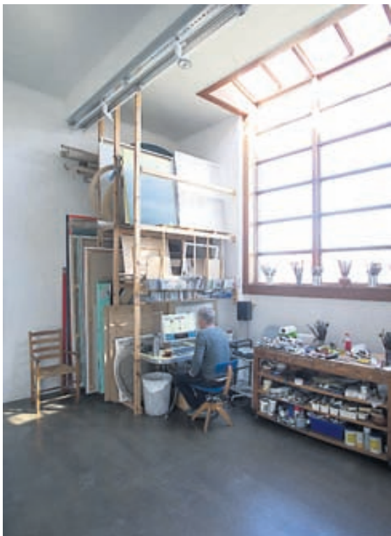
Sigtryggur að störfum.