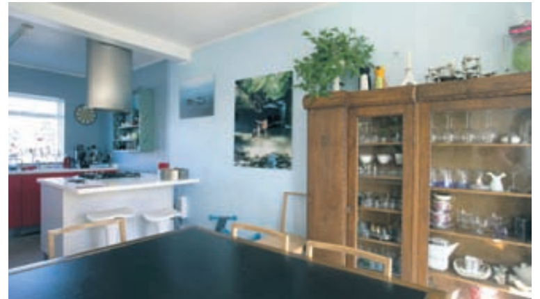
Eldhúsborðið er ferkantað og flott.