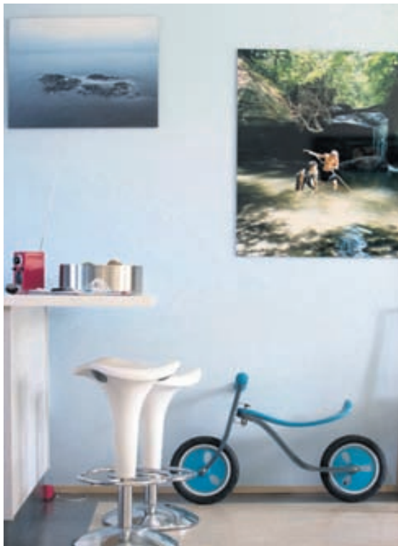
Skemmtilegir hlutir skreyta heimilið.