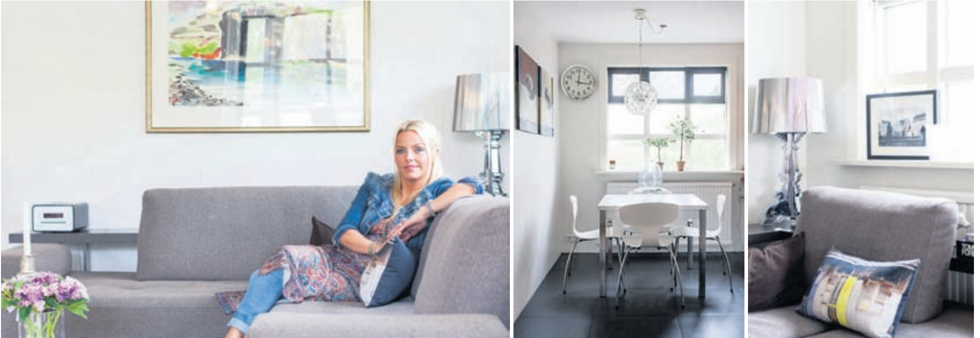
Heimili Evu er stílhreint en á sama tíma mjög hlýlegt.