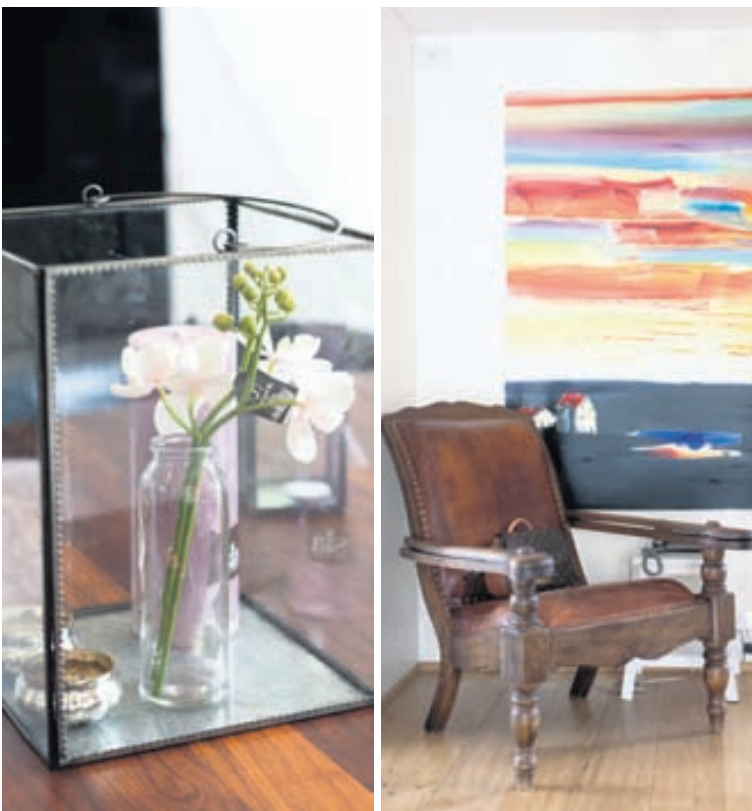
Eva hefur augljóslega hugsað út í hvert smáatriði.