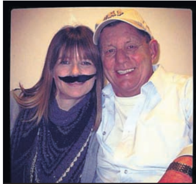
Með gleðigjafanum Hemma Gunn sem þjóðin syrgir þessa dagana.