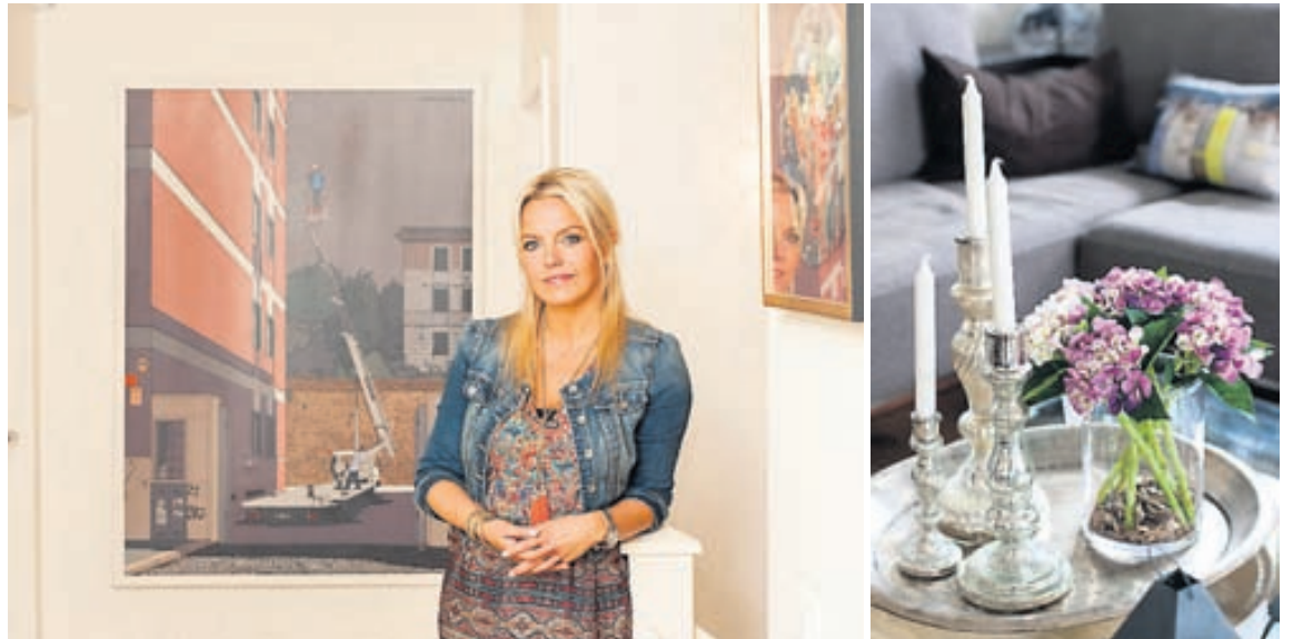
Nokkur skemmtileg listaverk prýða veggir heimilisins.