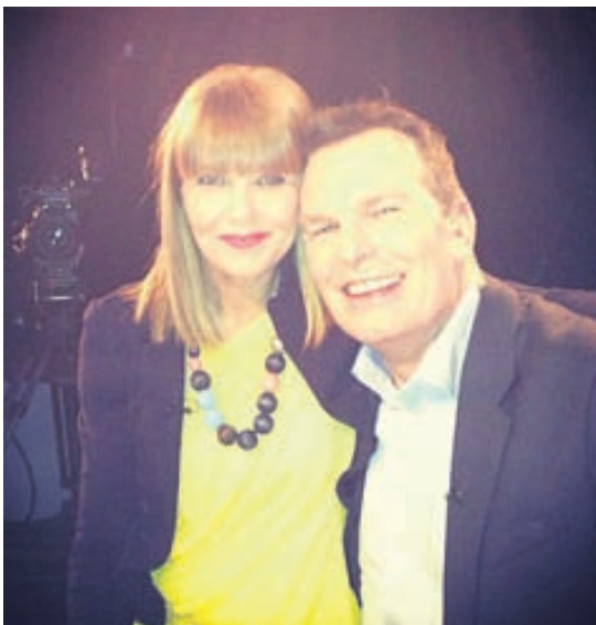
Með Loga á góðri stundu.