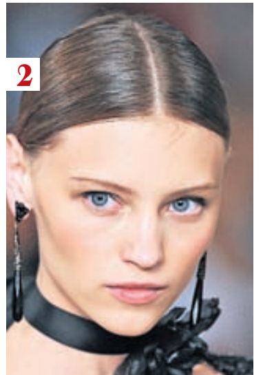
Skipt í miðju. Af vor- og sumarsýningu Ralphs Lauren.