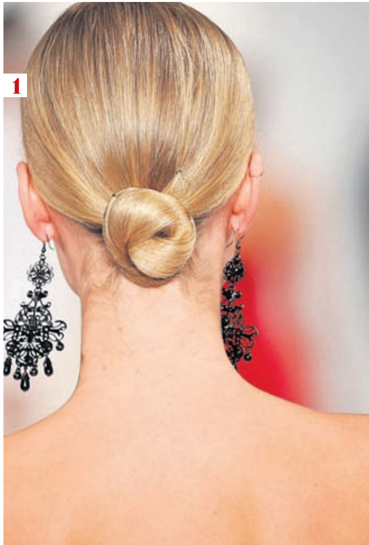
Lágt settur hnútur. Af vor- og sumartíkusýningu Ralphs Lauren.