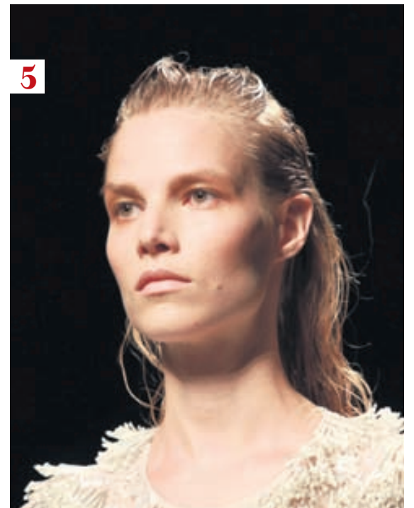
Blautt að ofan, tjásulegt að aftan. Af vor- og sumartíkusýningu Alberta Ferretti.