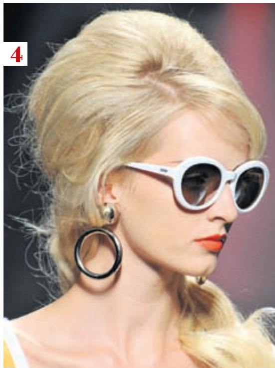
Sixtísgreiðsla. Af vor- og sumartíkusýningu Moschino.

5 Blautt og tjásulegt Í fyrra var bæði í tísku að vera með sleikt blautt hár og tjásulegt hár. Í ár hafa þessar greiðslur sameinast í eina. Til að fá rétta útlitið er hárið sleikt aftur frá enni með til þess gerðum efnum en endar hársins eru ýfðir.