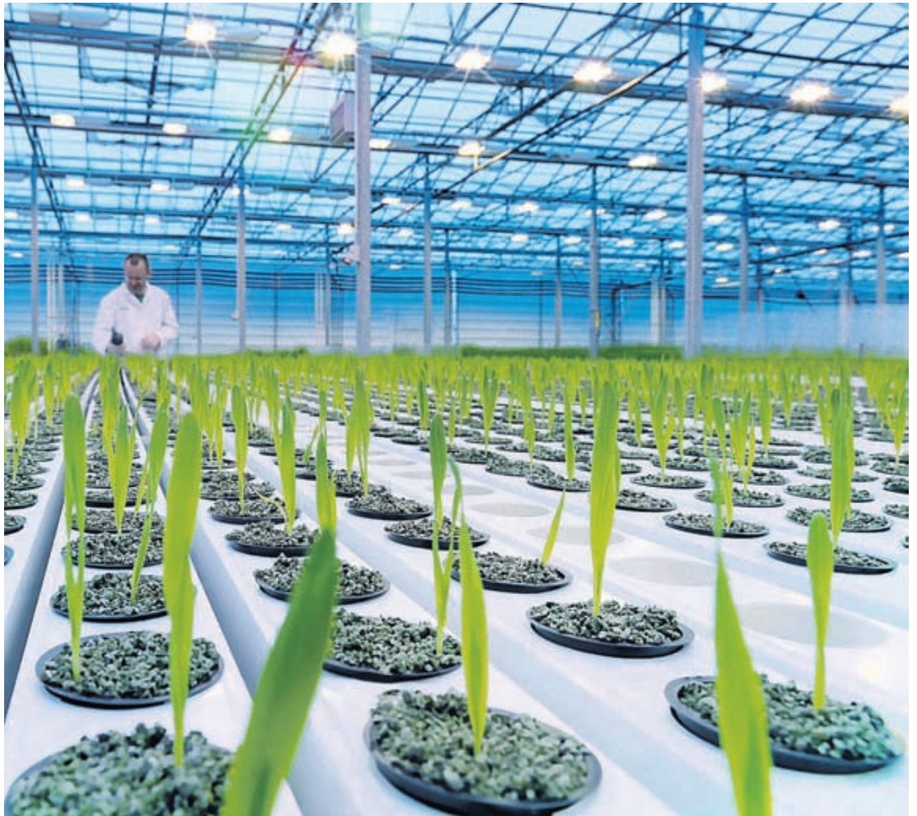
Á rannsóknastofu er smíðað bygg-gen sem segir byggfræinu hvernig á að búa til EGF sem er nákvæmlega eins og það EGF sem er í húðinni.

Þótt meirihluti landsmanna hafi lítið séð til sólar það sem af er sumri þá er fram undan sá tími þegar helst er hægt að njóta geisla hennar á Íslandi. Þá er mjög mikilvægt að huga vel að umhirðu húðarinnar og ekki síst skiptir gott „after-sun“ miklu máli. Vegna græðandi eiginleika EGF-frumuvakans í EGF-húðvörunum eru fáar vörur betur til þess fallnar að bera á sig eftir veru í sólinni.