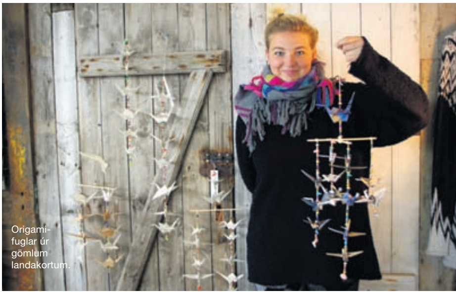
Origami-fuglar úr gömlum landakortum.