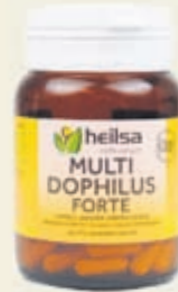
Multidophilus Forte með gula miðanum. Darf ekki að geyma í kæli!