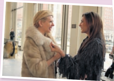
Spjallar við hönnuð.