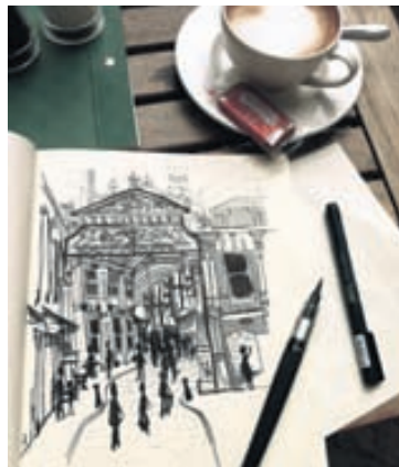
Teikniblokkin var alltaf nálægt.