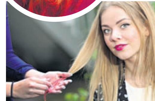
Krítarnar eru einfaldar og ansi skemmtilegar í notkun.

Hægt er að blanda saman litum og liturinn verður sterkari í blautu hári.