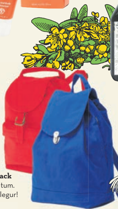
Baggu Back pack í sumarlegum litum. Kjörinn í allar útilegur!