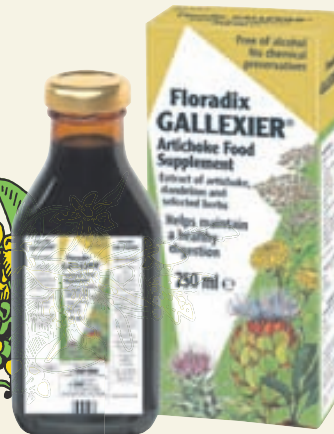
Gallexier 250 ml Fljótandi meltingarensím sem hjálpa líkamanum eftir stórar og þungar máltíðir.