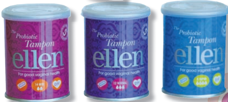
Tapparnir fást í þremur stærðum; mini, normal og super.

Ellen-vörurnar fást í öllum helstu apótekum.