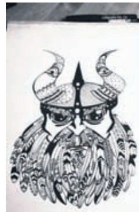
Vikingur með fjaðraskegg.