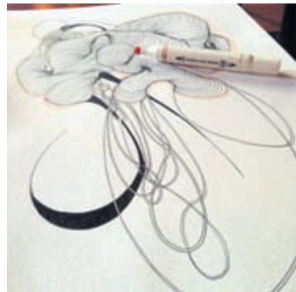
Abstrakt línuteikningar eru hennar hugarfóstur.