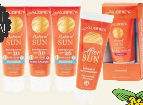
Frábær sólarvörn frá Aubrey fyrir alla fjölskylduna. Ekki brenna við!