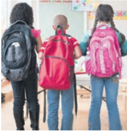
Ekki er sama hvernig tösku börn og unglíngar bera á bakinu. Á vef Landlæknis er að finna ráðleggingar iðjuþjálfara um val á skólatöskum.