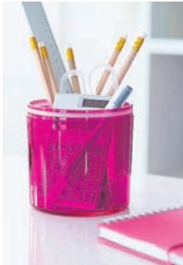
Óreiða dregur úr afköstum. Því er mikilvægt að koma reglu á bækur og smáhluti.

5 Forðastu alla óreiðu. Raðaðu bókum, flokkaðu pappíra í möppur og komdu reglu á smáhluti. Óreiða dregur úr orku og finnst flestum betra að vinna ef skrifborðið er snyrtilegt og allir hlutir á sínum stað.