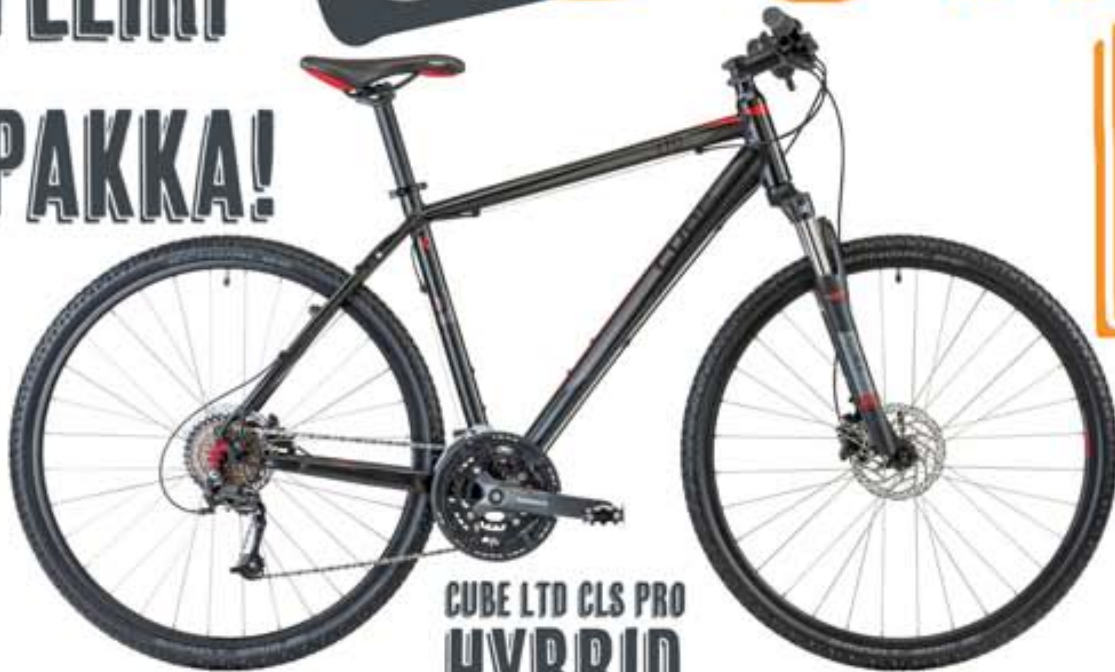
CUBE LTD CLS PRO HYBRID

VIÐ BJÓÐUM UPP Á STAÐGREIÐSLÁN FRÁ BORGUN BORGUN