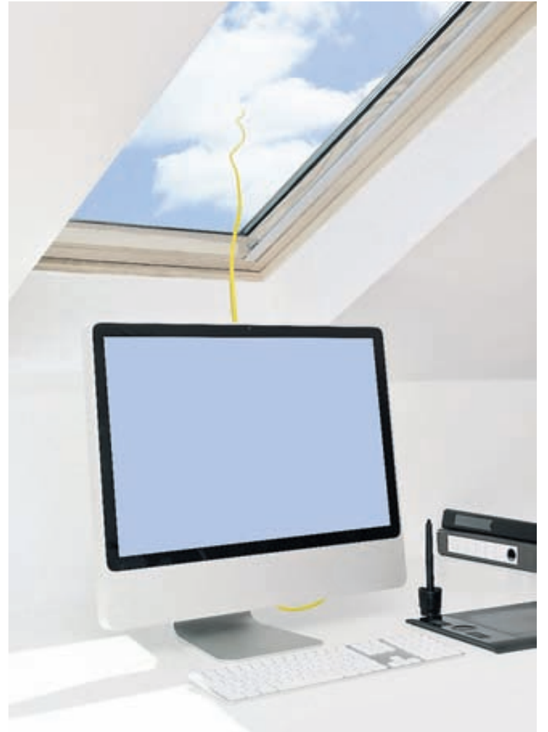
Til að halda einbeitingu og orku þarf líkaminn súrefni og ljós.