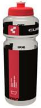
CUBE BRÚSAHALDARI & BRÚSI