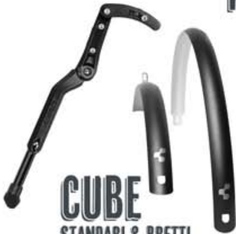
CUBE STANDARI & BRETTI