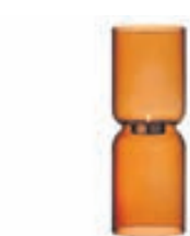
Lantern lukt / 18.900 kr.