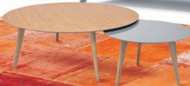
Lalinde sófaborð Verð frá 49.900 kr.