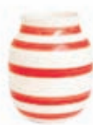
Omaggio vasi 20 sm / 8.990 kr.