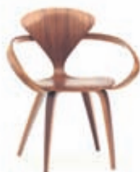
Cherner stóll / Verð frá 123.900 kr.