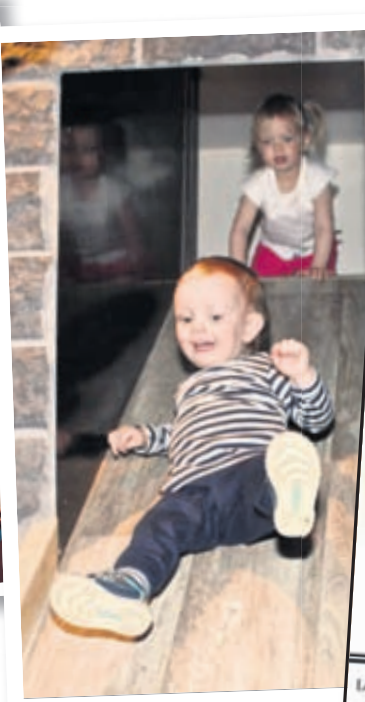
Nýja barnahornið á Culiacan hefur vakið mikla lukku hjá smáfólkinu.