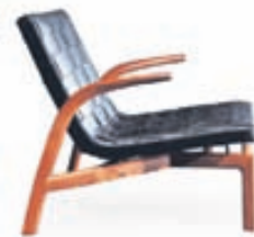
Pasmore stóll / Verð frá 379.900 kr.