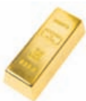
Gullstöng, hurðastoppari / Verð 12.900 kr.