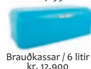
Brauðkassar / 6 litir kr. 12.900