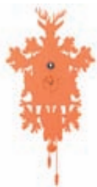
Cucu klukka / Verð frá 12.900 kr.