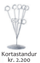
Kortastandur kr. 2.200