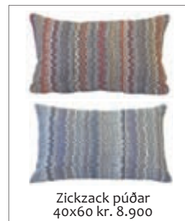
Zickzack púðar 40x60 kr. 8.900