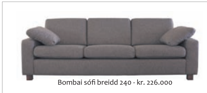
Bombai sófi breidd 240 - kr. 226.000