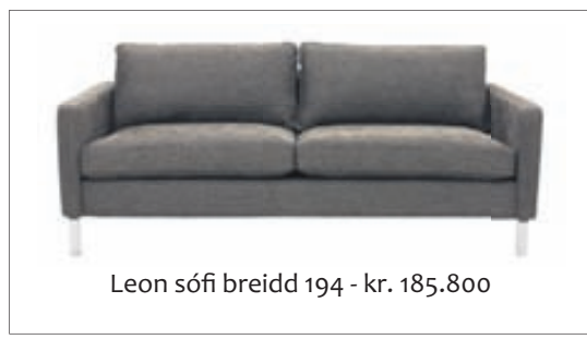
Leon sófi breidd 194 - kr. 185.800