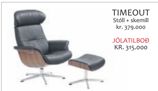
TIMEOUT Stóll + skemill kr. 379.000