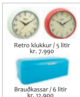
Retro klukkur / 5 litir kr. 7.990