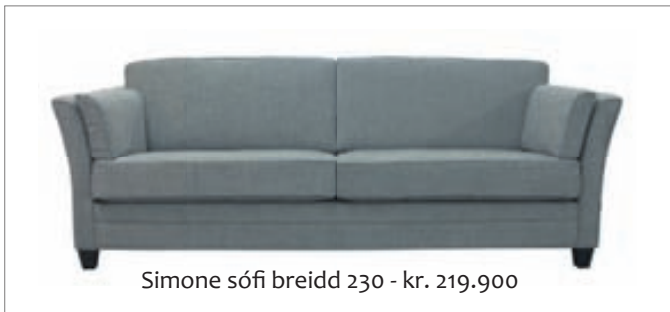
Simone sófi breidd 230 - kr. 219.900