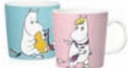
Moomin krúsir / Verð 3.450 kr.