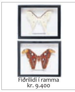
Fiðrilídi í ramma kr. 9.400