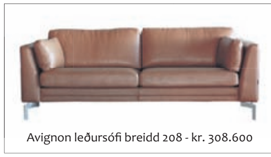
Avignon leðursófi breidd 208 - kr. 308.600