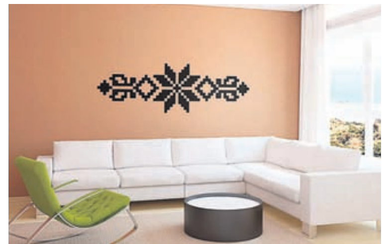
Vörulínun Farsælda Frón býður upp á fjölmörg falleg munstur á vegginn.