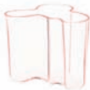
Aalto vasi / Verð frá 16.450 kr.