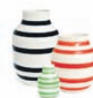
Omaggio vasi / Verð frá 3.890 kr.