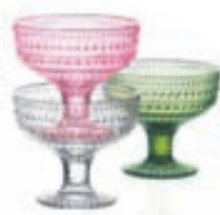
Kastehelmi skálar á fæti / Verð frá 3.790 kr.