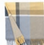
Elvang alpaca teppi / Verð 18.900 kr.