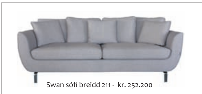
Swan sófi breidd 211 - kr. 252.200