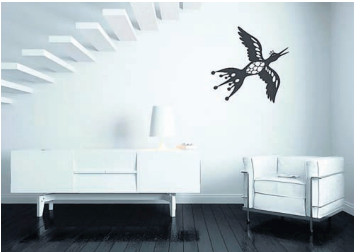
Í Kvak-vörulínunni er fuglapema sem móðir þeirra Veggsystra hannði.