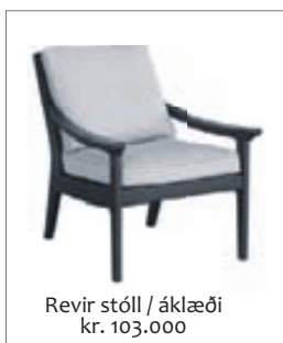
Revir stóll / áklæði kr. 103.000