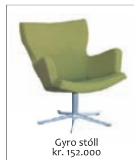
Gyro stóll kr. 152.000