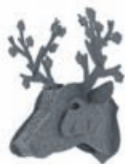
Miho Liquorice hreindýr / Verð 9.900 kr.