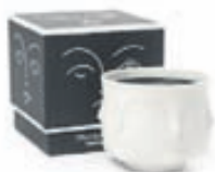
Muse ilmkeri / Verð frá 12.900 kr.