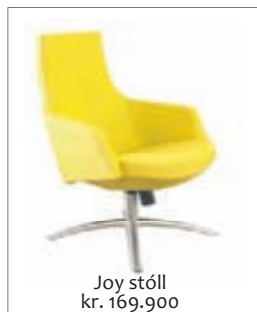
Joy stóll kr. 169.900