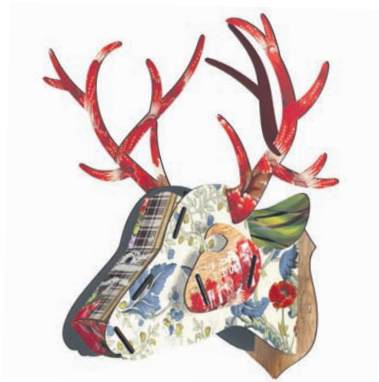
| Miho hreindýr, margar stærðir / Verð áður frá 5.500 kr.

föstudag, laugardag og sunnudag ef verslað er á modern.is