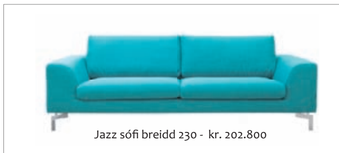
Jazz sófi breidd 230 - kr. 202.800