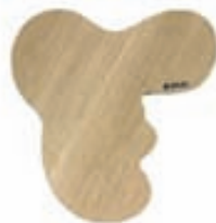
Aalto trébretti / Verð frá 7.650 kr.