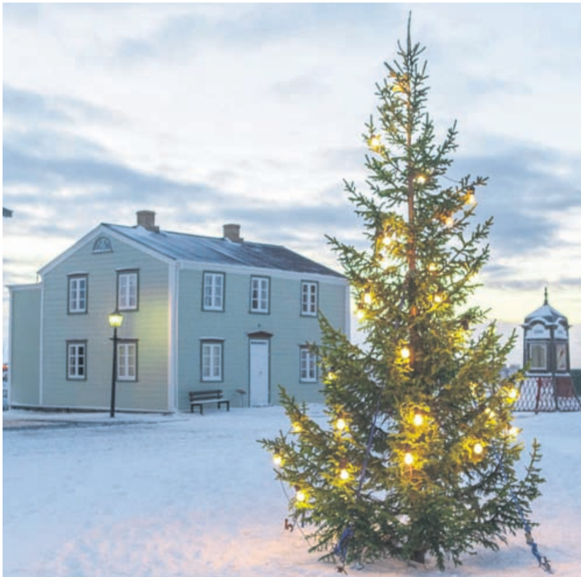
Á TORGINU Jólasýning Árbæjarsafns er orðin fastur liður í jólahaldi margra. Hægt er að skyggast inn í jólahald Íslendinga fyrr á árum og upplifa skemmtilega hátíðarstemningu. Dansað verður í kringum jólatréð á torginu klukkan 15 en sýningin er opin frá klukkan 13 til 17 næstkomandi sunnudag og tvo næstu sunnudaga fram að jólum.

„Nú sef ég samfelldan svefn, finn ekki fyrir hitakófum eða fótaóeirð og mér líður mun betur. Ég finn fyrir meiri vellíðan og er í mun betra jafnvægi í líkamanum. Með glöðu geði mæli ég því hiklaust með Femarelle við vinkonur mínar og allar konur sem finna fyrir breytingaaldrinum. Ég veit um eina vinkonu mína sem hætti á hormónum og notar Femarelle í dag. Ég get ekki ímyndað mér hvernig mér líði í dag ef ég hefði ekki kynnst Femarelle, þvílíkt undraefni.“