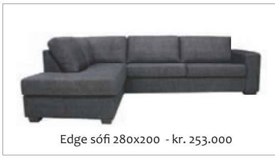
Edge sófi 280x200 - kr. 253.000