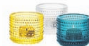
Kastehelmi kertastjaker / Verð frá 2.450 kr.