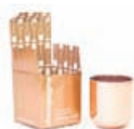
Pop ilmkeri / Verð frá 7.900 kr.