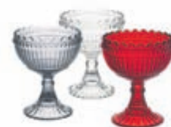
Marimekko skálar á fæti / Verð frá 4.950 kr.