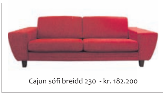
Cajun sófi breidd 230 - kr. 182.200