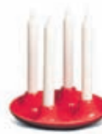
Illumina f. 4 kerli / Verð 12.990 kr.