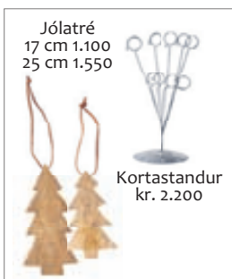
Jólatré 17 cm 1.100 25 cm 1.550