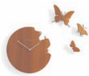
Butterfly 40sm. / Verð frá 33.900 kr.