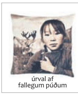
úrval af fallegum púðum