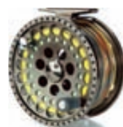
Vision GT Fluguveiðihjól