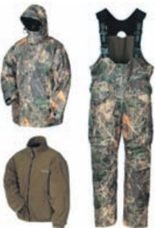
Norfin Expert Camo Galli