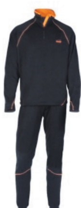
Norfin Winter Line Innanundir fatnaður