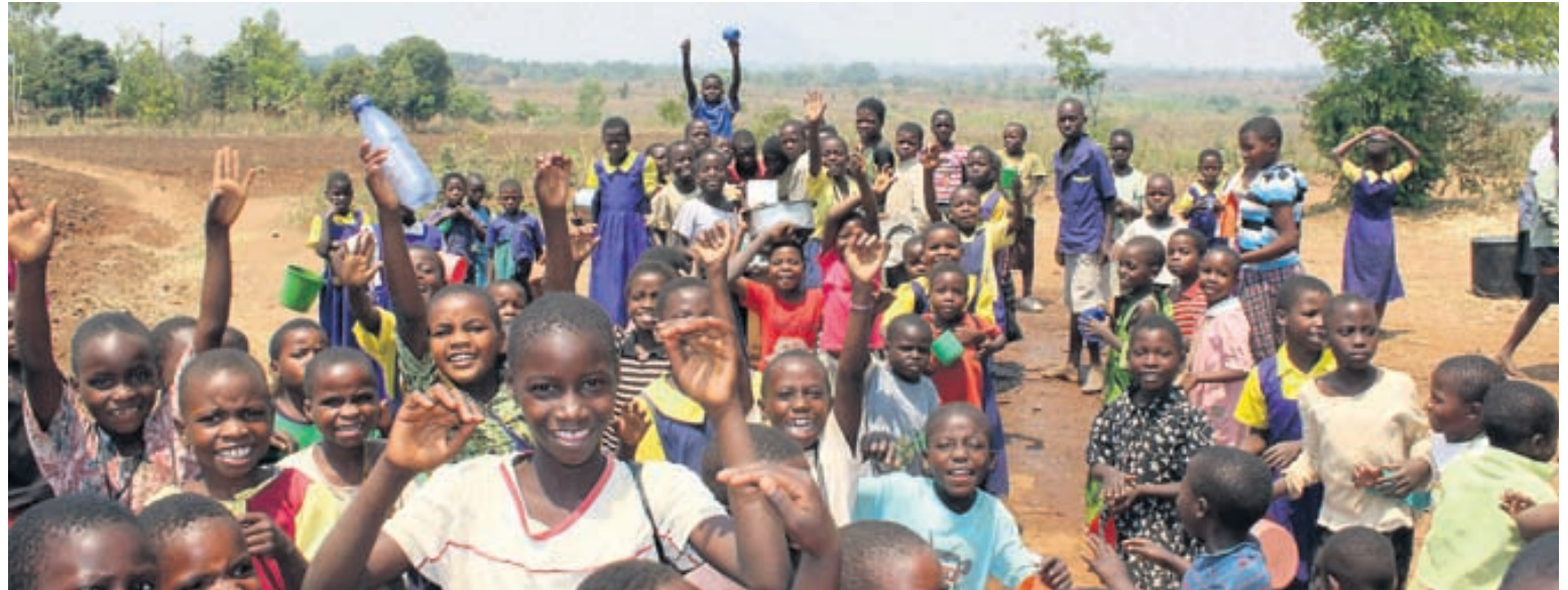
Fólkið í Malaví upplifir Eva sem einstaklega vinalegt, hjálpsamt og góðhjartað.