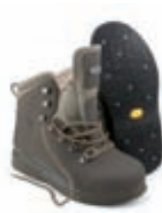
Vision Mako Vöðluskór