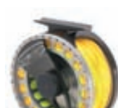
Vision Varioverse Fluguveiðihjól