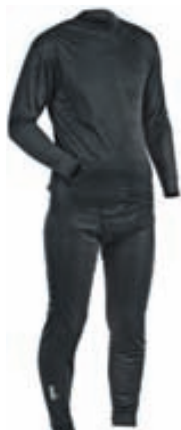
Norfin Thermo Line Innanundir fatnaður