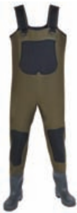
Norfin Neopran Vöðlur