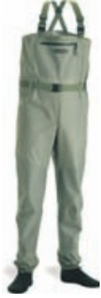
Vision Ikon Vöðlur