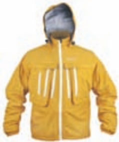
Vision Opas Vöðlujakki