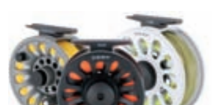
Vision Deep Fluguveiðihjól