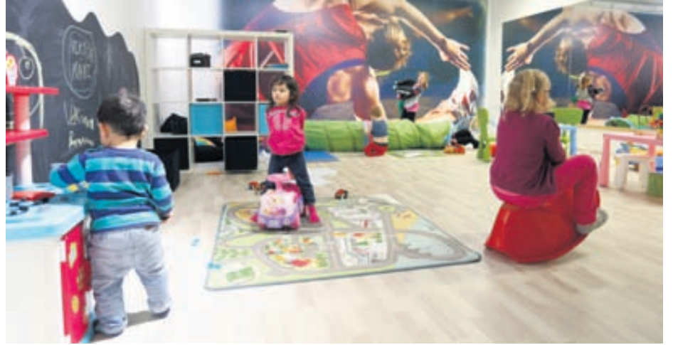
Barnagæslan í Reebok Fitness er notaleg og hlýleg og nóg rými fyrir börnin til að leika sér og njóta sín.