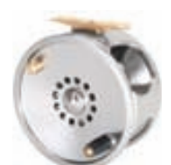
Vision Tank Fluguveiðihjól