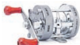
Salmo Diamond Bait Kasthjól