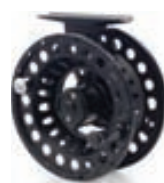
A. Jensen Gacka Fluguveiðihjól