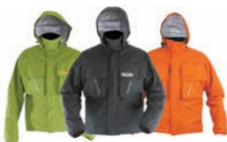
Vision Kura Vöðlujakkar