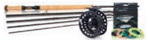
A. Jensen Tvíhendu Tilboð