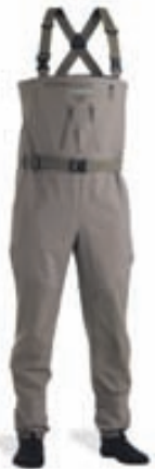
Vision Kura Vöðlur