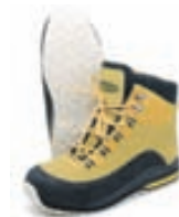
Vision Loikka Vöðluskór