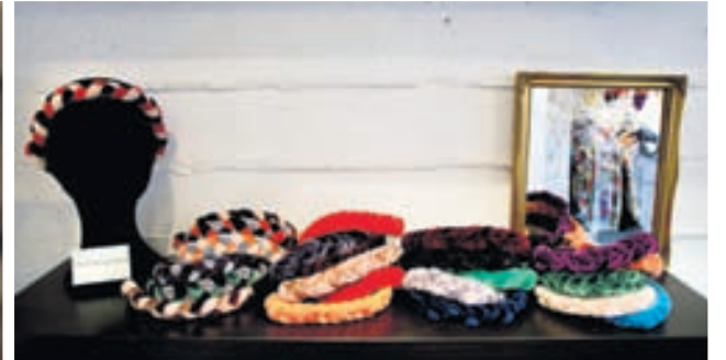
Fléttuböndin koma í mörgum spennandi litasamsetningum.