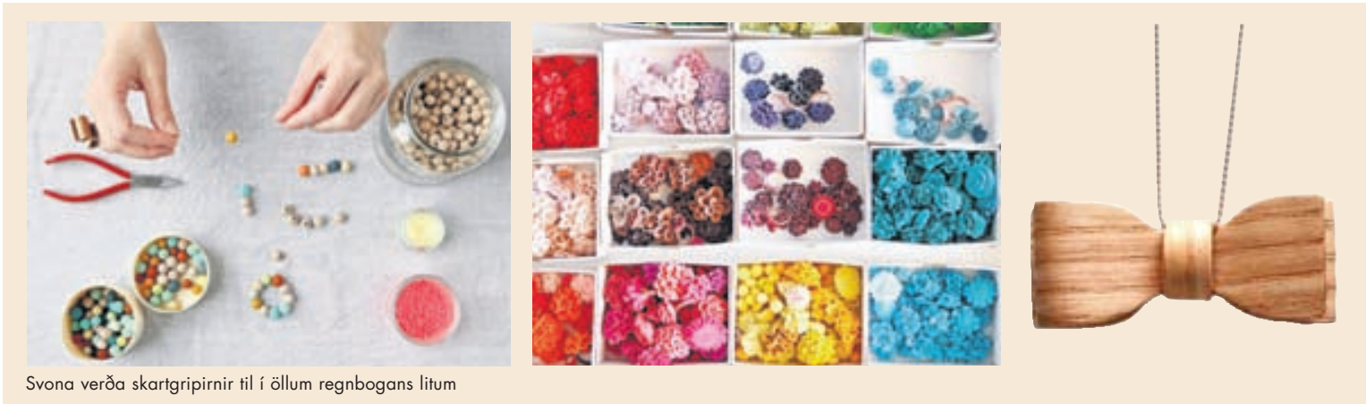
Svona verða skartgripirnir til í öllum regnbogans litum

Fólk sem hefur unun af því að vinna með höndunum, eins og ég sjálf.