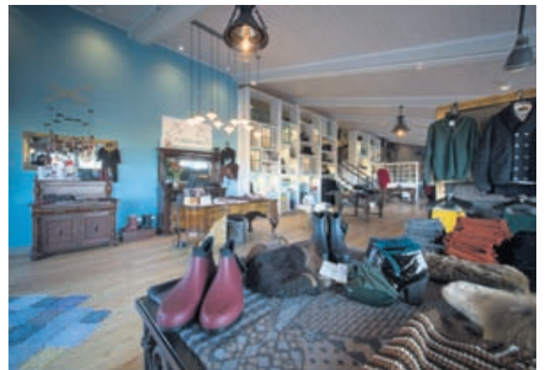
Kron Kron í Fákaseli.