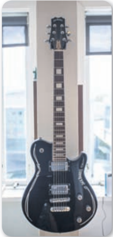
Ég starfaði fyrir Jack Daniels í nokkur ár og eignaðist þennan á þeim tíma.

Grjótið í gólfinu tíndi ég í Dritvík á Snæfellsnesi. Drumburinn kom úr garði foreldra minna en ég lakk-aði toppinn á honum hvítan. Mér þykir gaman að færa náttúruna inn til mín og er með eitthvert blæti fyrir skinnnum og feldum. Þarna má sjá villisvínsfeld, selskinn, rauðrefsfeld og einhverja fugla sem átta frekar einhliða samskipti við haglabyssuna mína.