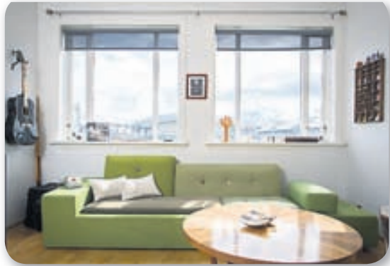
Poulder-sófinn er jafn fallegur og hann er óþægilegur. Ég get ekki gert gestum að sitja í þessu.