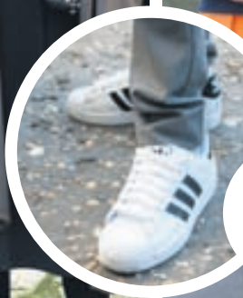
Þessir gömlu góðu skór fá uppreisn æru um helgina.