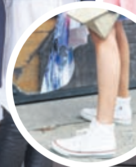
Converse við partíklæðnaðinn.