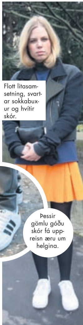
Flott litasamsetning, svartar sokkabuxur og hvítir skór.