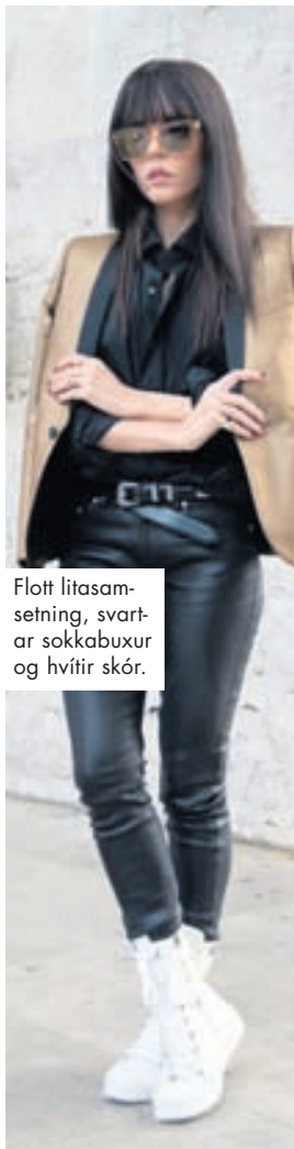
Flott litasamsetning, svartar sokkabuxur og hvítir skór.

Alla jafna eru strigaskórnir dregnir fram þegar hlýna fer í veðri og sólin hækkar á lofti. Í ár eru hvítir strigaskór mest áberandi á tískuradarnum. Skínandi hvítir strigaskór setja sumarlegan blæ á hvaða fatnað sem er og um að gera að sprufa sig áfram í samsetningum. Hér má til dæmis sjá tiskulegar dömur sem klæðast hvítum skóm við síðkjóla og leðurbuxur.