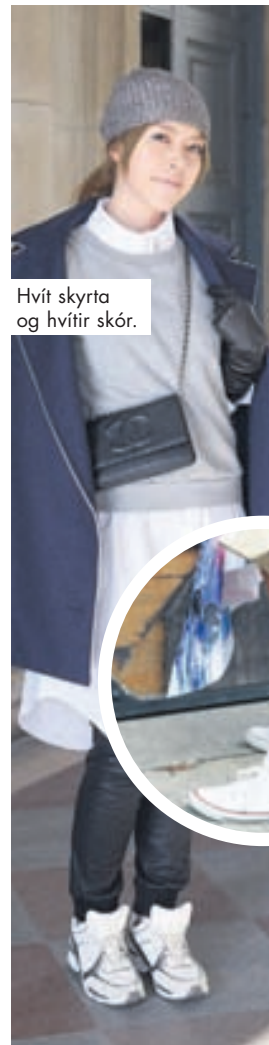
Hvít skyrta og hvítir skór.