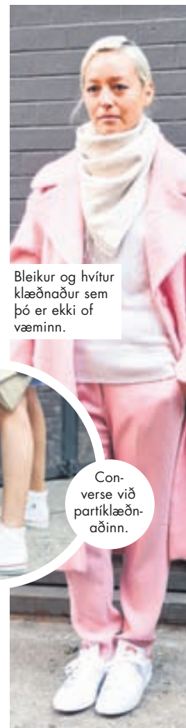
Bleikur og hvítur klæðnaður sem þó er ekki of væminn.