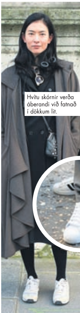
Hvítu skórnir verða áberandi við fatnað í dökkum lit.