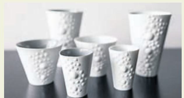
Bollarnir koma í þremur stærðum. Munstrið er þrívítt og sest kaffið því innan í berin þegar drukkið er úr bollunum.