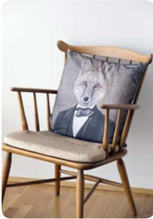
Púðann fékk ég í fertugsafmælisgjöf og er einstaklega ánægð með hann.