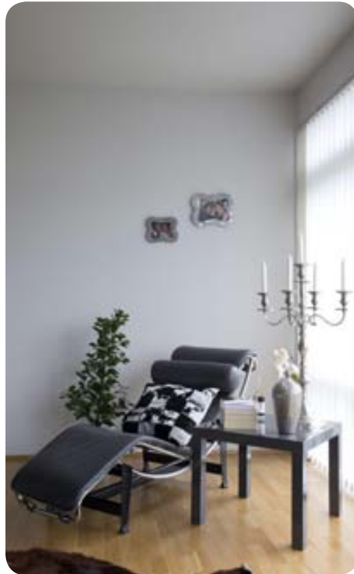
Stóllinn er frá Cassina og heitir LC4 Chaise Lounge. Það er æðislegt að slappa af í honum og spjalla í símann, fletta tímaritum eða lesa góða bók. Borðið er frá Ikea og stóra kertastjakann fann ég á genbrugssölu í Köben.