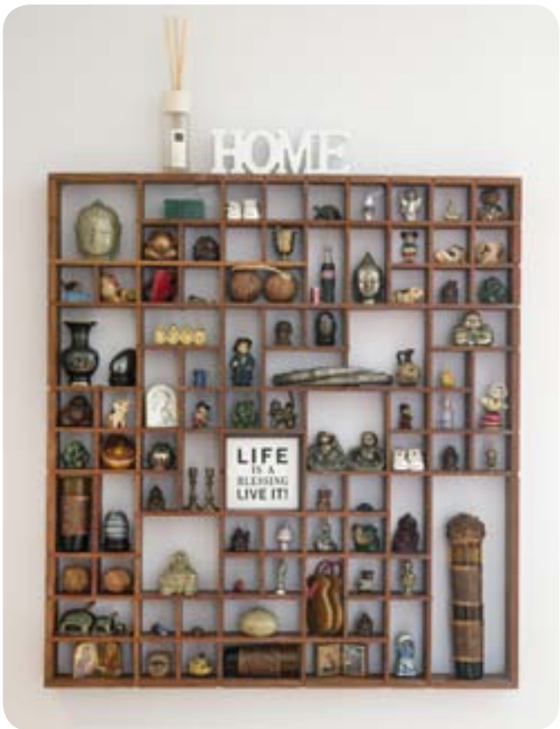
Þessa hillu bjó pabbi minn til. Ég er búin að eiga hana síðan ég man eftir mér. Allt dótið í henni er eitthvað sem ég hef safnað að mér á ferðalögum því ég vil ekki kaupa stóra muni. Þarna er að finna ýmislegt frá Róm, Kína og fleiri spennandi stöðum.