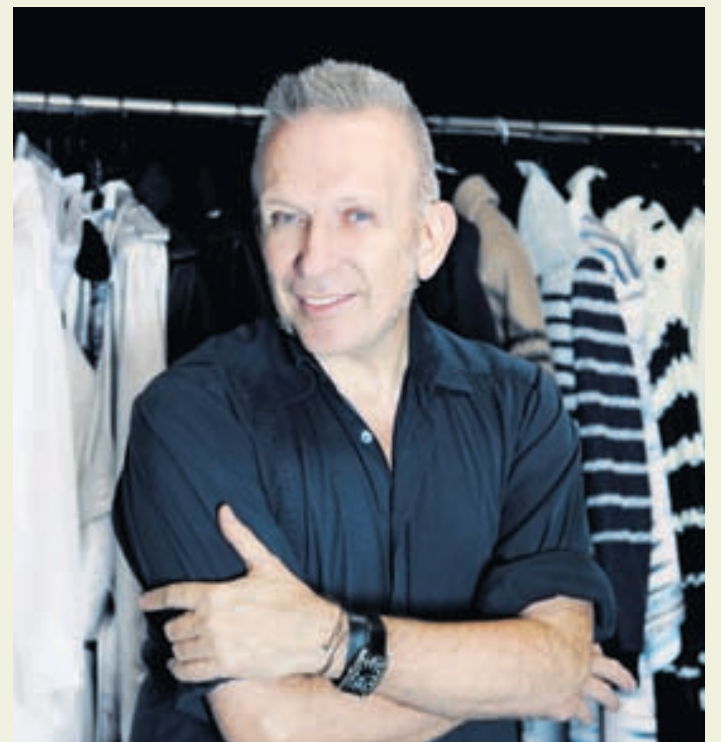
Jean Paul Gaultier í París við vinnu á línunni fyrir Lindex.

Í Jean Paul Gaultier-línunni er kventískufatnaður, barnaföt, fylgihlutir og undirfatnaður. Línan verður fánleg í útvöldum verslunum Lindex þann 8. október og mun 10% af söluandvirði ganga til rannsókna og baráttu Krabbameinsfélags Íslands gegn brjóstakrabbameini.