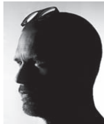
Jónatan Grétarsson ljósmyndari.

Nánari upplýsingar um verk hans er að finna á vefsíðunni jonatangretarsson.com.