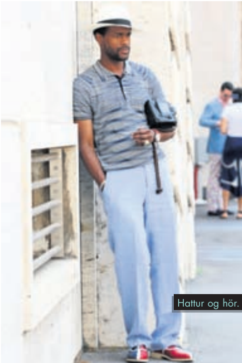
Hattur og hör.