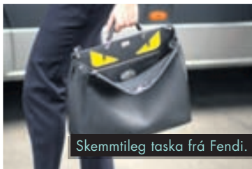
Skemmtileg taska frá Fendi.