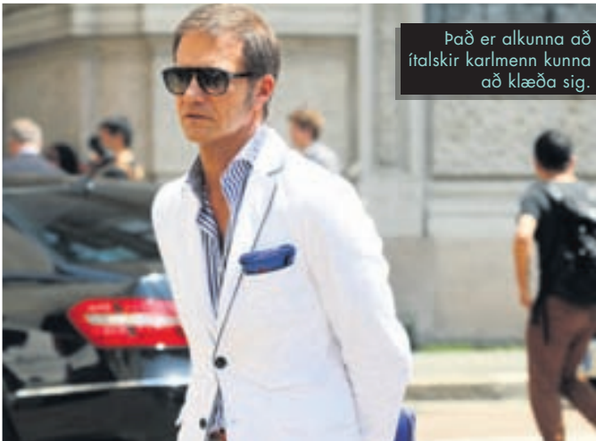
Það er alkunna að ítalskir karlmenn kunna að klæða sig.