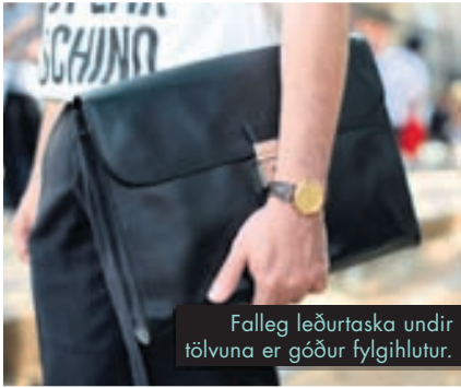
Falleg leðurtaska undir tölvuna er góður fylgihlutur.