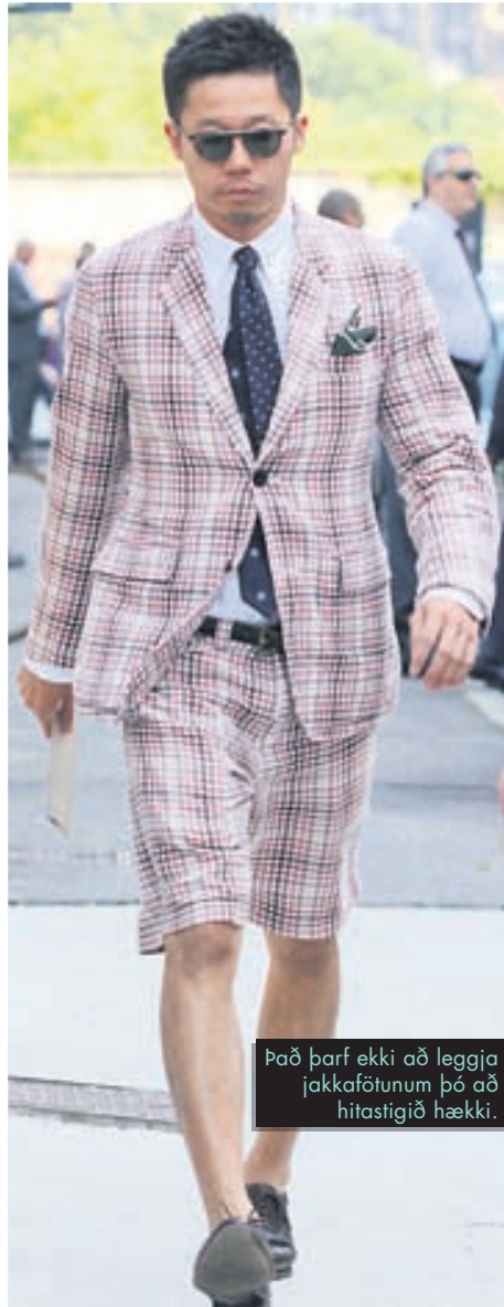
Það þarf ekki að leggja jakkafötunum þó að hitastigið hækki.