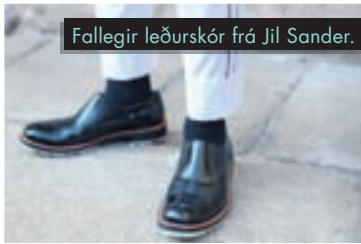
Fallegir leðurskór frá Jil Sander.