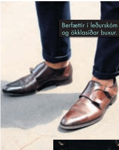
Berfættir í leðurskóm og ökklassiðar buxur.