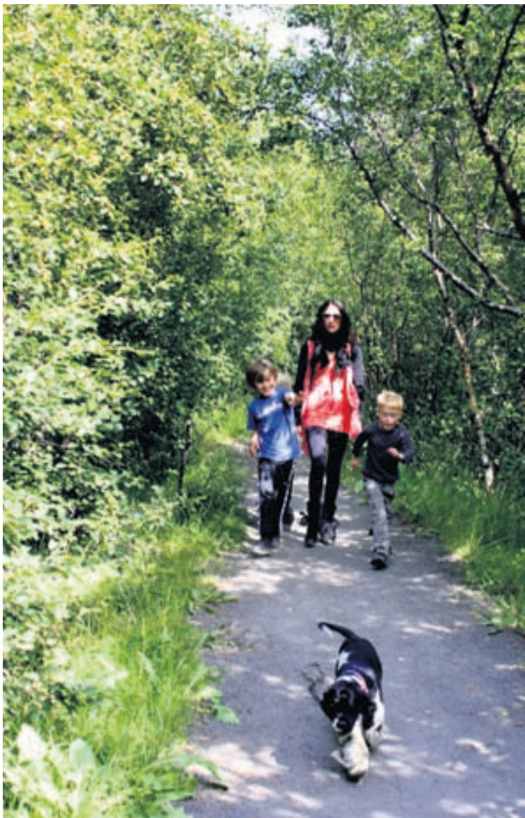
Öskjuhlíðin býður upp á margt skemmtilegt fyrir alla fjölskylduna.