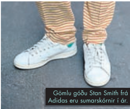
Gömlu góðu Stan Smith frá Adidas eru sumarskórnir í ár.