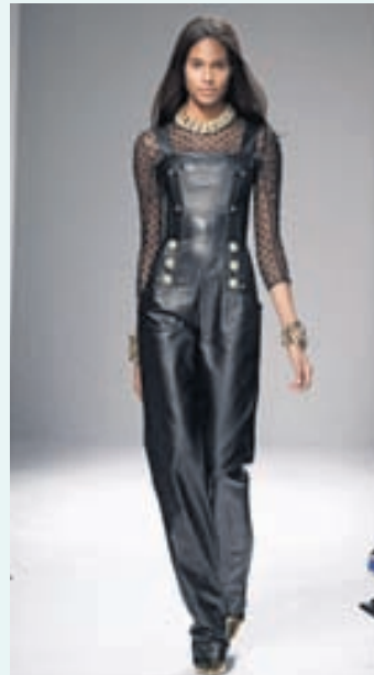
Leðursamfestingur á tískupöllum hjá Balmain.

Helstu tískuspekúlantar heims hafa klæðst smekkbuxum undanfarið, með stuttum skálmum og síðum, úr gallaefni og jafnvel leðri. Hressileg sumartrend.