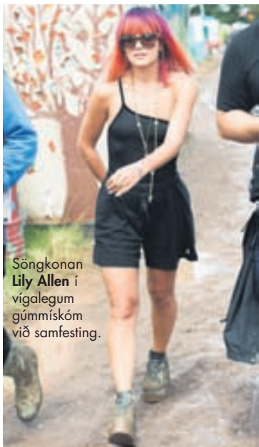
Söngkonan Lily Allen í vígalegum gúmmískóm við samfesting.