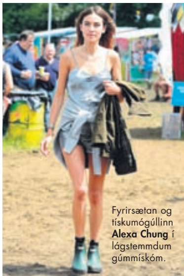
Fyrirsætan og tiskumógullinn Alexa Chung í lágstemmdum gúmmískóm.