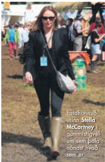
Fatahönnuðurinn Stella McCartney í gúmmístígvélum sem þola nánast hvað sem er.