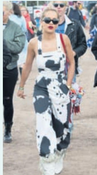
Söngkonan Rita Ora í munstruðum smekkbuxum á Glastonbury.