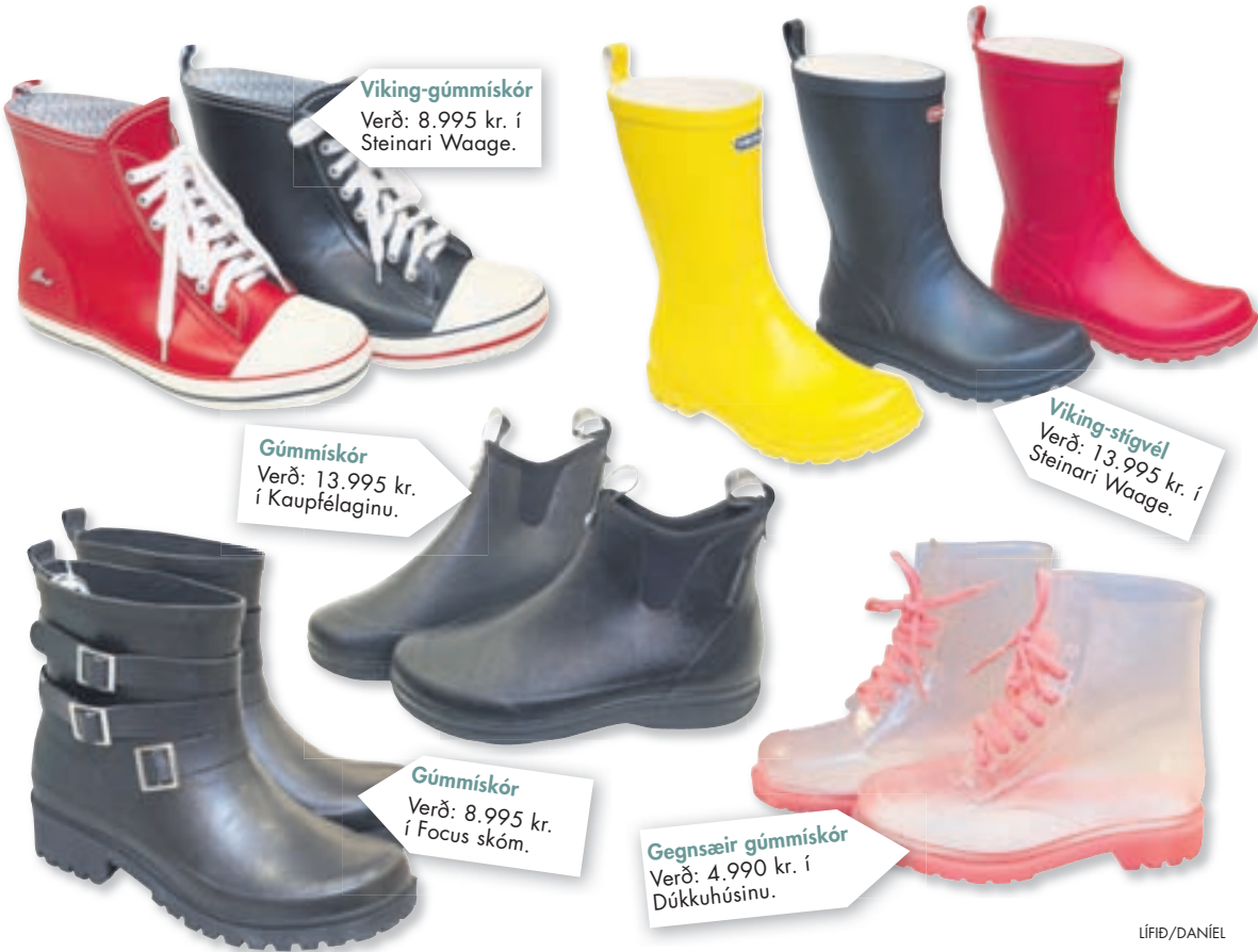
Viking-gúmmískór Verð: 8.995 kr. í Steinari Waage.

Rigningin virðist ætla að heiðra okkur talsvert með nærveru sinni í sumar, líkt og síðasta sumar. Til að halda samt í gleðina er um að gera að vera vel skóaður enda úrvalið af gúmmískóm og -stígvélum gott á landinu. Svo er um að gera að sækja sér innblástur frá stjórnunum sem klikkuðu ekki á gúmmískófatnaði á nýafstaðinni Glastonbury-hátíð og sönnuðu að gúmmístígvél ganga við nánast allt.