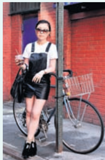
Stutt og leður á götum New York.