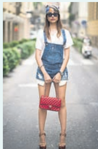
Smekkbuxur með sumarlegu íváfi.