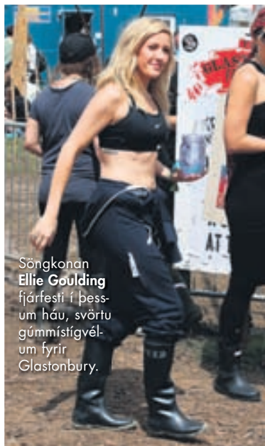
Söngkonan Ellie Goulding fjárfesti í þessum háu, svörtu gúmmístígvélum fyrir Glastonbury.