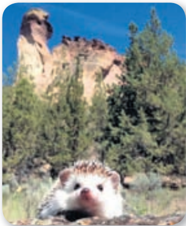
Biddy The Hedgehog http://instagram.com/biddythehedgehog

Fylgst er með ævintýrum hins smáa og krúttlega Biddy, sem er broddgöltur ættaður frá Afríku.