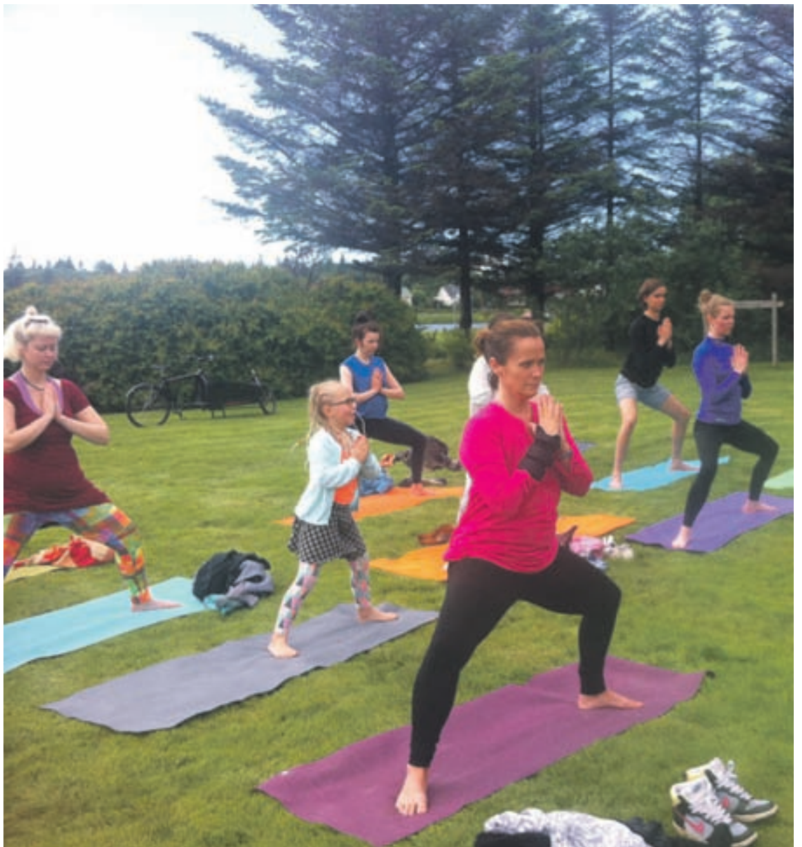
Jóga er ákaflega slakandi og styrkjandi íþrótt sem byggist á innri friði.