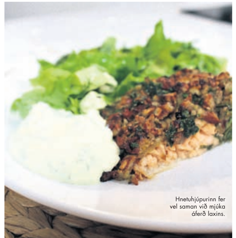
Hnetuhjúpurinn fer vel saman við mjúka áferð laxins.