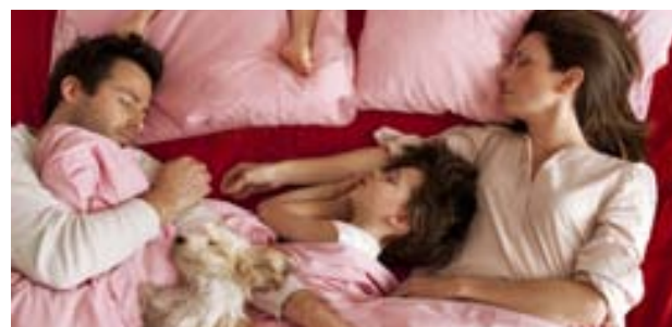
Bóndadagur varð bara að köldum degi í janúar en ekki sólarhring af ástarjátningum.

Heimurinn var okkar eigin cronut og við gúffuðum lystisemdirnar í okkur. Ætli það mætti ekki segja að við vorum svona óþolandi krúttpar sem var alltaf að dúllast eitthvað fyrir hvort annað. Sumir jafnvel gengu það langt að kalla okkur fullkomnið par. Ég lét slíkar athugasemdir liggja á milli hluta en við pössuðum upp á okkur, bæði sem einstaklinga og sem par. Við gáfum hvort öðru loford um að vera parið sem gerir allt saman og mætir á alla viðburði sem fjölskylda. Svo kom barnið og svo börnin. Nýr raunveruleiki blasti við. Bóndadagur varð bara að köldum degi í janúar en ekki sólarhring af ástarjátningum.