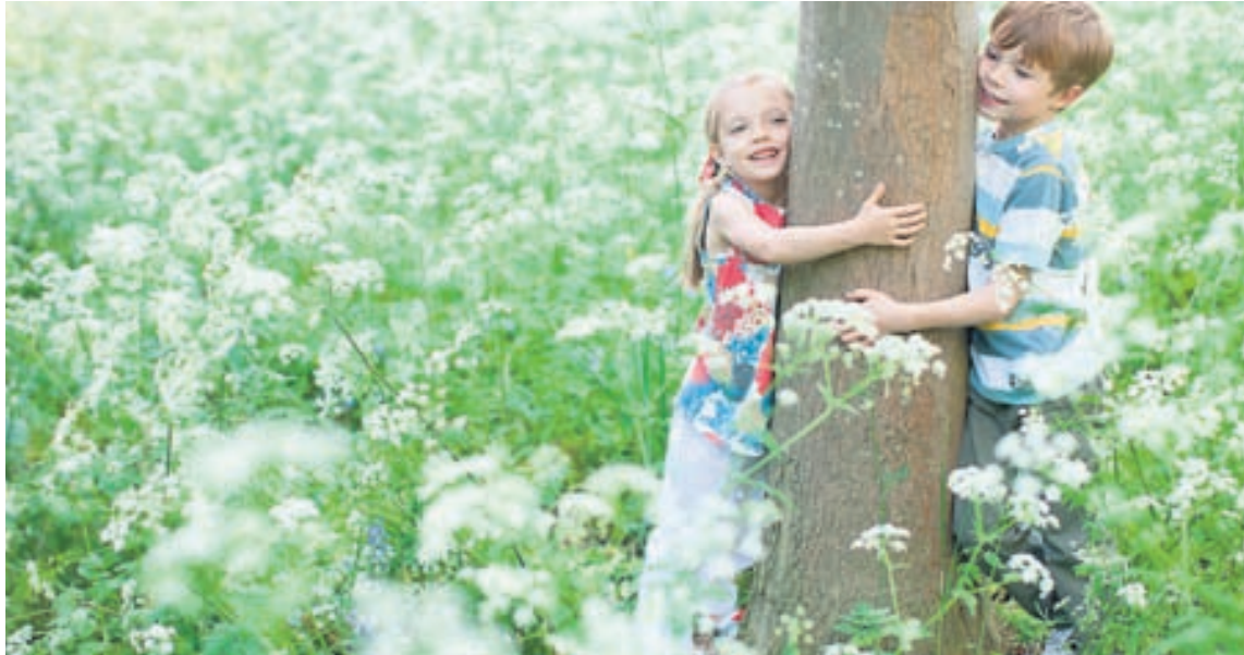
Það skiptir máli fyrir heiminn eins og hann er í dag og eins og hann verður í framtíðinni að snúa við blaðinu í umhverfisvitund.

Eins og það er þægilegt að henda öllu í þurrkarann þá notar