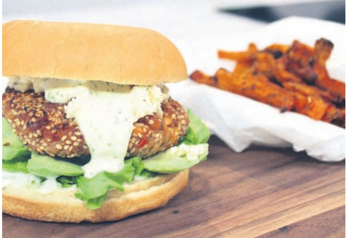
Laxaborgari er góð og holl tilbreyting frá hefðbundnum hamburgara og sætar kartöflur eru hollari útgáfa af frönskum kartöflum.

Sætar kartöflur skornar í aflangar sneiðar eins og franskar kartöflur. Þeim er svo velt upp úr ólífuolíu, maldonsalti, grófum pipar og góðri kryddjurtablöndu, til dæmis Best á allt frá Pottagöldrúm. Kartöflurnar bakast við 220 gráður í um 30 mínútur.