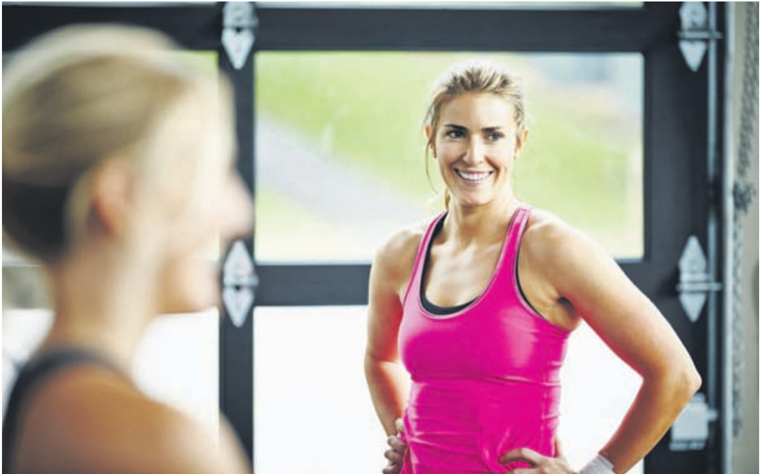
Hvaða markmiðum viltu raunverulega ná, eru einhver markmið mikilvægari en önnur?