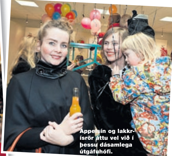
Appelsín og lakkrísörör áttu vel við í þessu dásamlega útgáfuhófi.