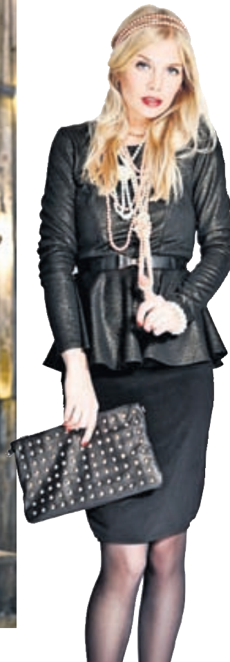
Peplum bolur, 18.900 kr. Pensil pils, 12.900 kr. Leðurtaska, 15.900 kr. Hönnuður: Andrea Magnúsdóttir (www.andrea.is)