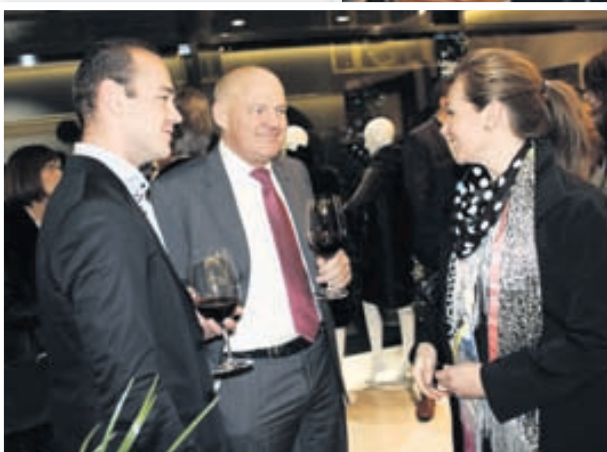
Fjárfestirinn Klaas og sonur hans létu sig ekki vanta.