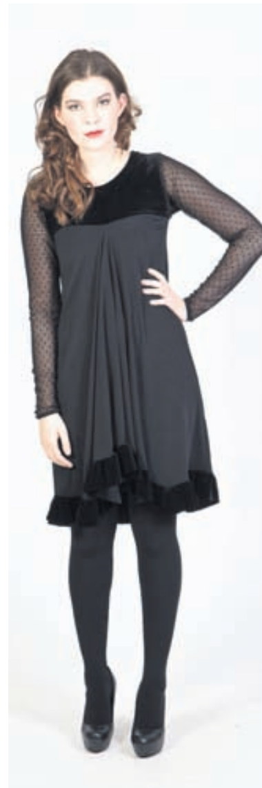
Svartur pífu kjöll með doppöttum ermum, 29.900 kr. SHE (www.madebyshe.is)/ Hönnuður: Silja Hrund Einarsdóttir.