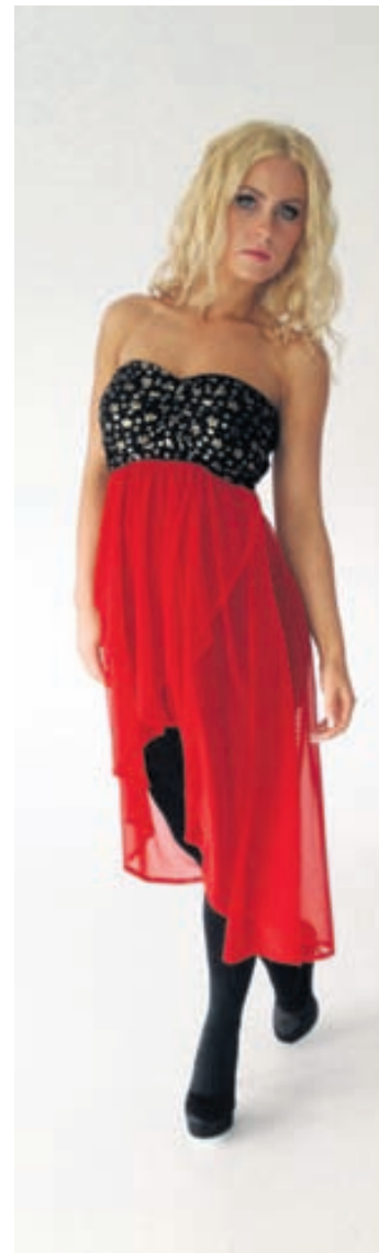
Jóla kjöll 27.900 kr, Ryk (www.ryk.is)/Hönnuður: Kristín Kristjánsdóttir.