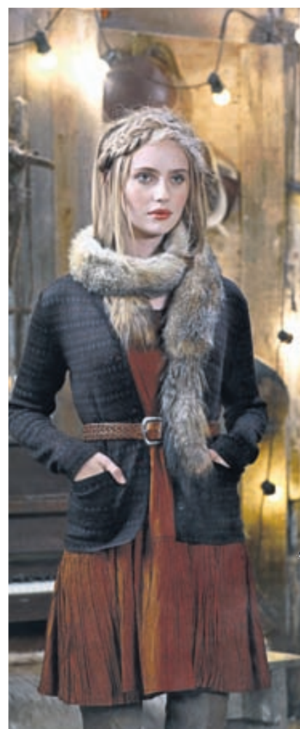
Ryðrauður silkikjöll, 28.500 kr. Hönnuður: Farmers market (www.farmersmarket.is).

Það er ánægjulegt að styrkja íslenskt, en úrval íslenskrar hönnunar hefur aukist hratt að undanförunu. Lífið kíkta á nokkra álitlega jóla kjóla eftir íslenska hönnuði fyrir hátíðarnar.