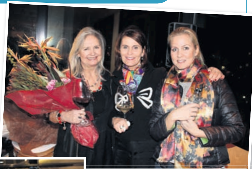
Ester eigandi með fallegan vönd ásamt góðum vinkonum.

Pelsinn flutti í nýtt húsnæði á Tryggvagötu 18 á dögunum. Glæsilegir gestir fögnuðu í „Svörtu perlunni“ eins og húsnæðið er kallað.