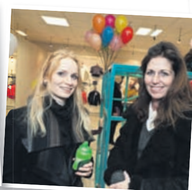
➤ Sjá nánar á visir.is/lifid