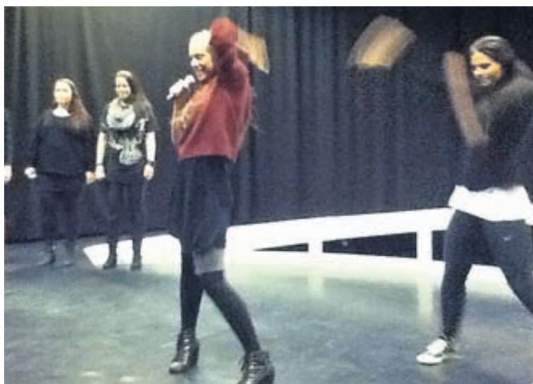
Æfing með dönsurum og bakröddum fyrir sjónvarpssalinn.