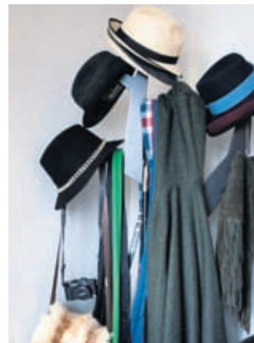
Hattar, fót og töskur skreyta fallega snaga heimilisins.