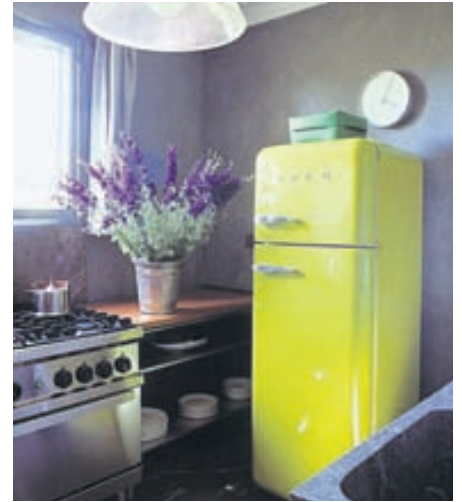
Hér lífgar ísskápurinn upp á þetta annars dökka eldhús.

Ekki vera hrædd við að sýna persónuleika þinn í þessum rými og mála eða setja upp veggfóður í djörfum lit eða eftir því hvernig liggur á þér. Það getur líka verið skemmtilegt að hafa áberandi hluti í lit inni í eldhúsinu eins og Smeg-ísskápana eða vinsælu Kitchen Aid-vélarnar sem fást í mörgum litum. Það brýtur mjög skemmtilega upp. Ef eldhúsið er opið má svo finna lausnir með skápum og stórum hurðum til að hægt sé að fela allt eldhúsdótið þegar ekki er verið að nota það.