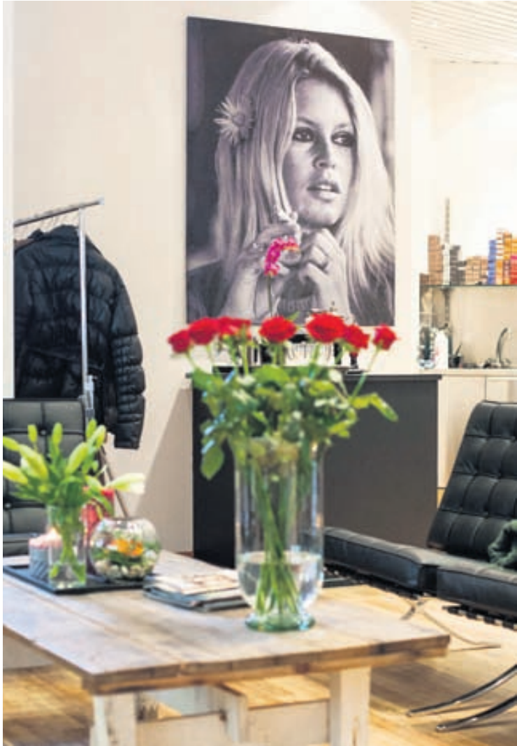
Rómantísk og kósý stemning ríkir á biðstofunni.