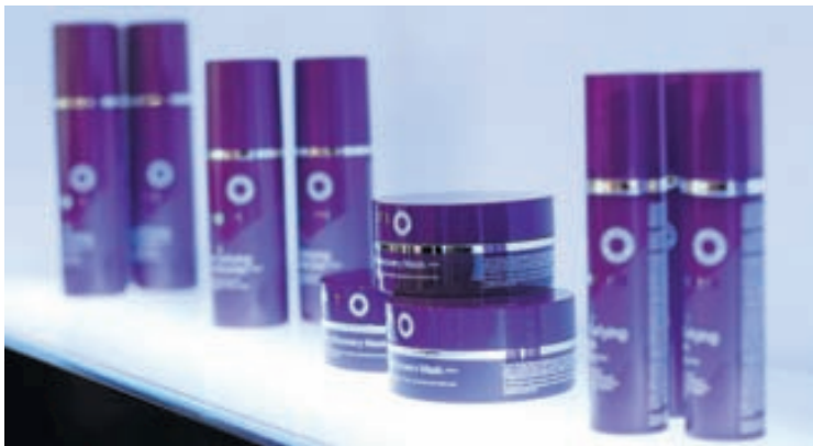
Label M. hárvörur fást í úrvali.