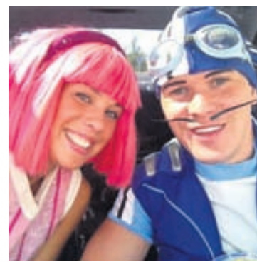
Við Dýri íþróttálfur á rúntinum!