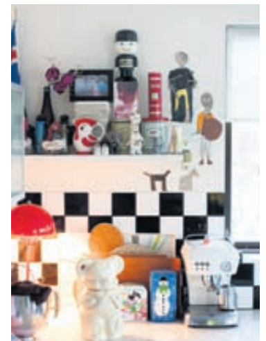
Heimili Öldu er einstaklega litríkt og skemmtilegt.