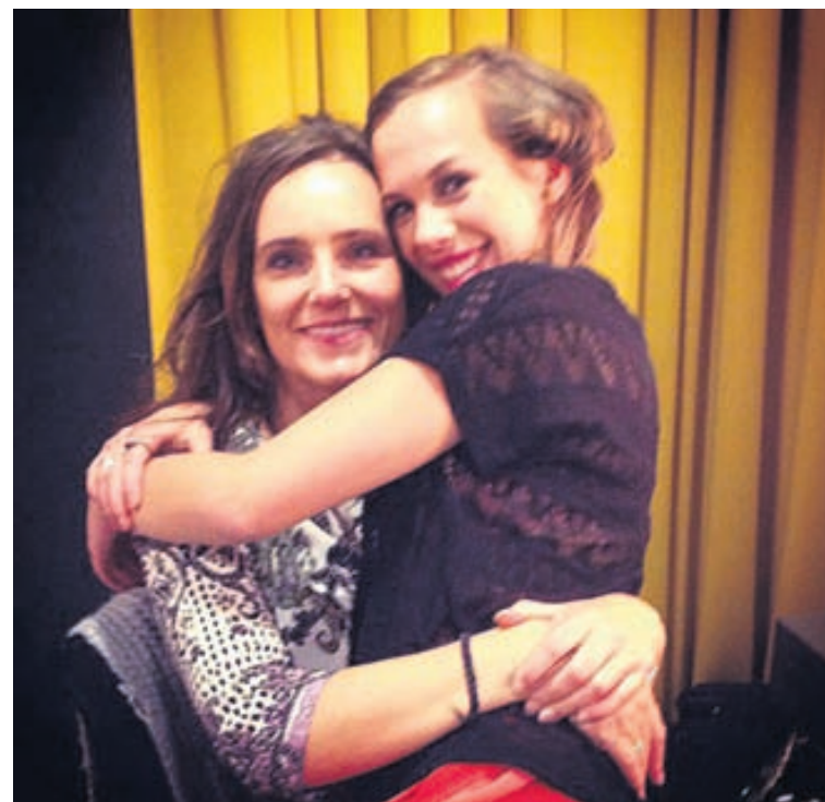
Ekki til betri leið til að undirbúa sig en í faðminum á mömmu.