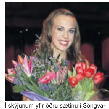
Í skýjunum yfir öðru sætinu í Söngvakeppni sjónvarpsins!