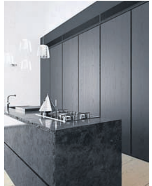
Hér má sjá nokkur mismunandi eldhús í misjöfnum stílum. Leyfið hugmyndafluginu að ráða og gerir þetta aðalrími heimilisins persónulegt og hlýlegt eða þannig að öllum fjölskyldumeðlimum líði vel.