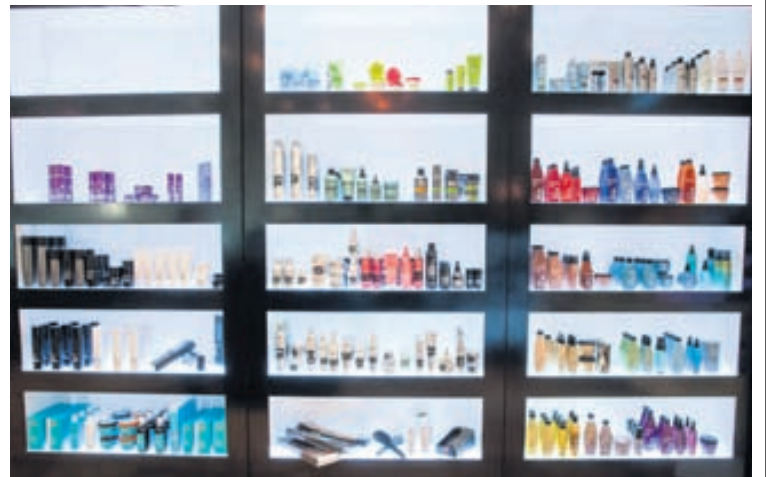
Við bjóðum viðskiptavinum okkar upp á bestu hárvörur á markaðnum,“ segir Kalli.

Víða erlendis tíðkast að fólk fái svokallaða hraðþjónustu í þjölun og lökkun á nöglum. „Við á Beauty