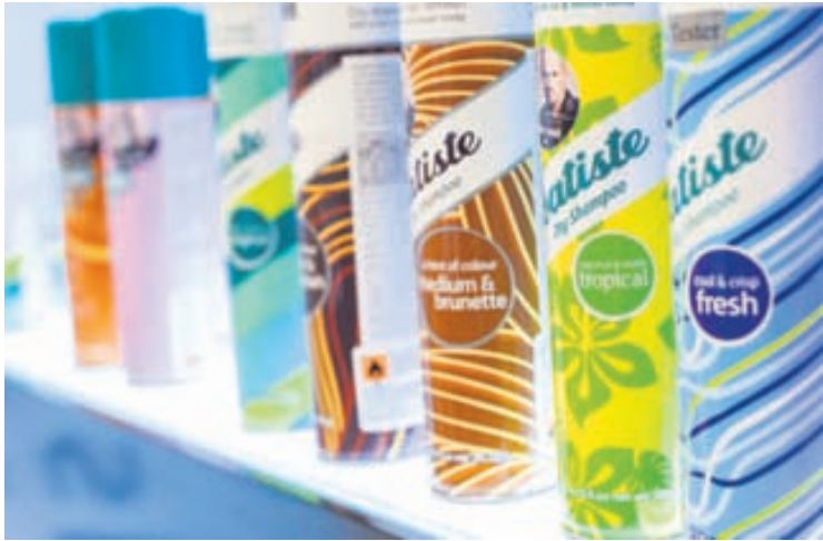
Hárið virkar hreint á augabragði með þurrsjampói frá Batiste.