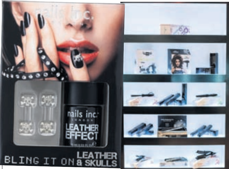
Nails Inc er einstaklega vandað merki. Það nýjasta er naglalakk með leðuráferð. Þá fást vönduð krullujárn, hárblásarar og burstar frá HH Simonsen á Beauty Barnum.