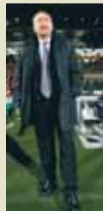
Gerard Houllier, fyrrverandi stjóri Liverpool, vildi fá Hermann í lið sitt.

fram á síðustu stundu ásamt Hermanninum þegar hann skrifaði undir hjá Portsmouth í sumar vegna áhuga annarra liða.