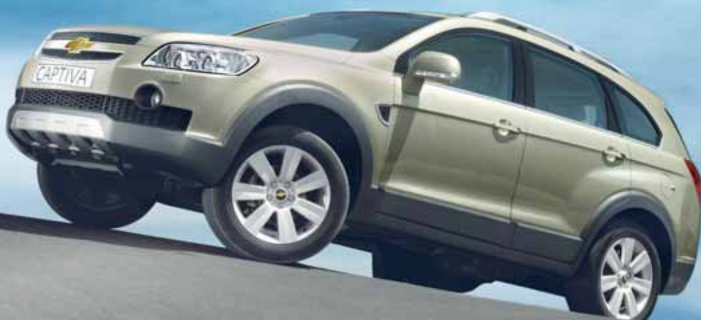
Chevrolet Captiva 7 manna sportjeppinn sem tekið er eftir