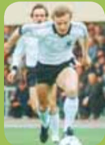
HANS PETER BRIEGEL

Hann var tugþrautarmaður sem byrjaði að æfa fótbolta 17 ára gamall. Algjört tröll að burðum, rúmlega 190 cm á hæð og yfir 100 kg en samt með mikinn hraða og gríðarlegan stökkkraft. Þjálfun hans í tugþrautinni kom honum svo sannarlega að notum í fótboltanum og með þrotlausri þjálfun allan ferilinn bætti hann sig stöðugt sem knattspyrnumaður. Hann var hrikalega erfiður við að eiga og lét mann venjulega finna vel fyrir því, enda ekki að ástæðulausu sem menn fá viðurnefnið „Valtarinn“.