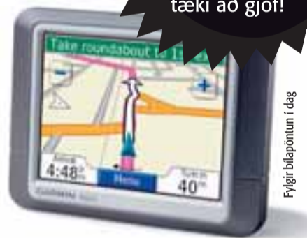
Fylgir bílapöntun í dag