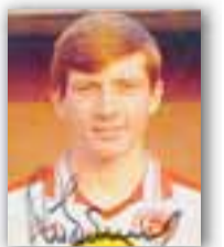
Atli Eðvaldsson á sínum yngri árum sem leikmaður í Þýskalandi. Eftir að leikmannaférlinum lauk hefur Atli fengist nokkuð við þjálfun með góðum árangri.

Hann spilaði allan sinn feril hjá Bayern-München og varð margfaldur meistari með þeim. Hann er þessi „100% týpa frá Bæjaralandi“. Hann var ofsalega skynsamur en jafnframt harður leikmaður sem gafst aldrei upp. Þegar maður hélt að það hefði tekist að komast fram hjá honum var hann kominn aftur í bakið á manni og það er aðdáunarverður eiginleiki hjá varnarmönnum. Hann lagði sig alltaf allan fram og það gerði hann að einum öflugasta varnarmanni heims.