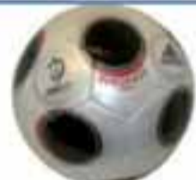
EM boltinn 2008 Frá kr. 2.490.-