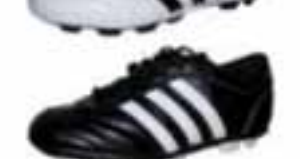
Adidas Questa TRX FG & TF Barnastærð. 28 – 38,5