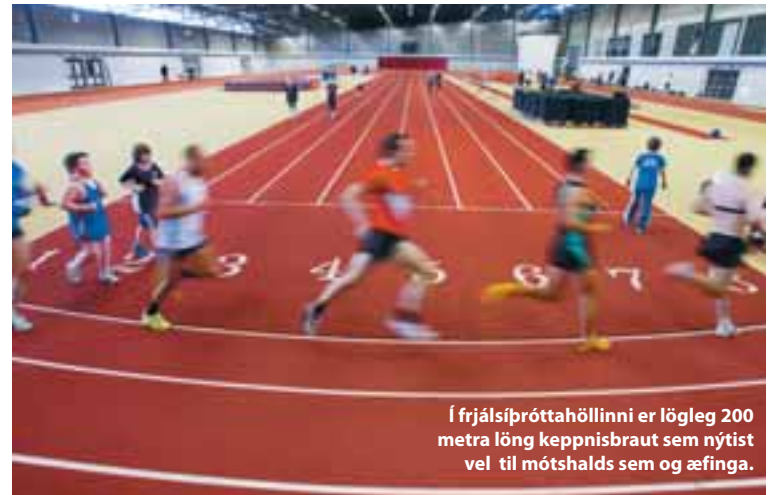
Í frjálsíþróttahöllinni er lögleg 200 metra löng keppnisbraut sem nýttist vel til mótshalds sem og æfinga.