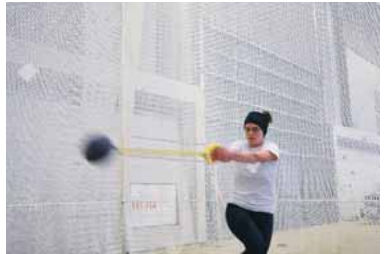
Hér sést ungur sleggjukastari við æfingar en sleggjunni er kastað í netið sem er í bakgrunni.