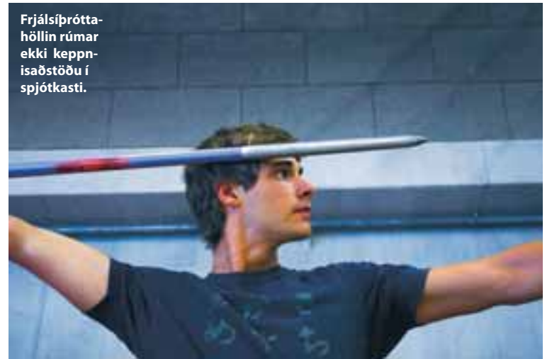
Frjálsíþróttahöllin rúmar ekki keppnisaðstöðu í spjótkesti.